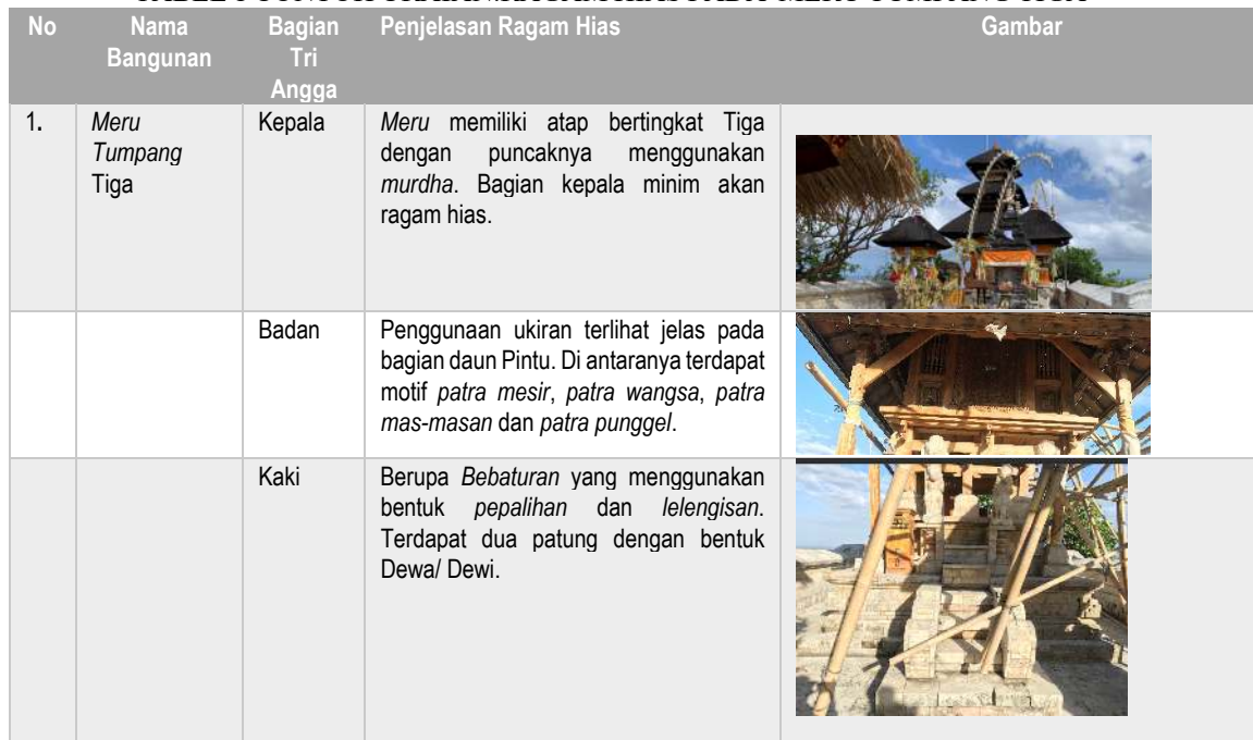
TABEL 1 CONTOH URAIAN.RAGAM HIAS PADA MERU TUMPANG TIGA

Sementara keindahan bangunan kerap juga disebut sebagai nilai estetis yang terkandung di dalam desainnya. Sehingga suatu karya arsitektur dikatakan berhasil apabila dapat berdiri dengan kokoh dan stabil (struktur), berfungsi dengan baik serta estetik (indah). Pada bangunan Arsitektur Tradisional Bali, salah satu penentu nilai estetisnya adalah dengan penggunaan ragam hias pada bagian kepala, badan dan kaki. Masih dalam sumber yang sama, pepalihan merupakan bentuk hiasan yang umumnya dipakai pada pada bebaturan pasangan, batu untuk pelinggih-pelinggih pemujaan atau bale kulkul. Bentuk-bentuk pepalihan umumnya tanpa ukiran, keindahan bentuknya terletak pada variasi permainan garis pepalihan. Sedangkan lengisan merupakan bentuk hiasan tanpa ukiran, keindahan dari bentuk-bentuk hiasan dengan permainan variasi timbul tenggelamnya bidang-bidang hiasan dan penonjolan bagian-bagian tertentu. Bentuk hiasan lengisan umumnya disatukan dengan hiasan pepalihan. Salah satu pembahasan mengenai ragam hias pada Meru Tumpang Tiga di Utama Mandala Pura Uluwatu akan disajikan dalam bentuk tabel sebagai berikut: