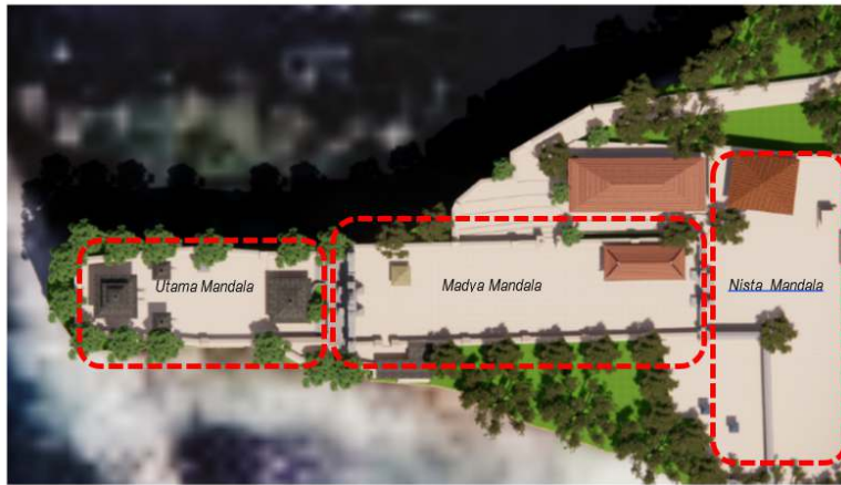
GAMBAR 1. STRUKTUR PURA ULUWATU BERDASARKAN TRI MANDALA PADA TAHUN 2023 [SUMBER: SALAIN NRP, DKK. MARET, 2023]

Balai Pelestarian Cagar Budaya dalam Salain, NRP (2022) mengatakan bahwa ukuran masing-masing wilayah adalah sebagai berikut: Jaba Sisi memiliki panjang 13,25 m dan lebar 12,43 m; Jaba Tengah memiliki panjang 35,54 m dan lebar 9,20 m; dan Jeroan memiliki panjang 28,30 m dan lebar 8,10 m. Lihat ilustrasi di bawah ini untuk lebih jelas: