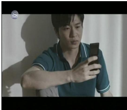
Gambar (5) : PG SBU (02:09)