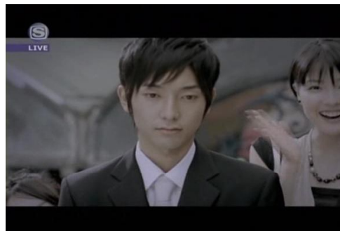
Gambar (2) : PG DKSNSD 1 (01.19)