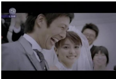
Gambar (1) : PG DKSNSD (01:14)