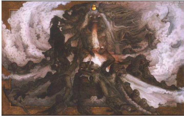
Buta Kala (2003). Dokumentasi Ketut Budiana

Ketut Budiana secara sadar menggunakan filosofi-filosofi Hindu dan Bali dalam karya-karyanya. Namun yang coba ditampilkan bukanlah ragam karya yang molek dengan pilihan bentuk ataupun sapuan warna yang beraneka sebagaimana yang umumnya dapat disaksikan pada karya tradisi Bali. Budiana mengambil warna-warna gelap, bahkan beberapa lukisan warna hitam menjadi dominan. Di sisi lain, bentuk-bentuk makhluk yang dihadirkan menunjukkan sosok yang mirip dengan rangda atau leak , dan sebagian lainnya mencerminkan gambaran wajah menyeramkan yang imajinatif.