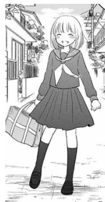
Gambar 3. Ekspresi senang tokoh Yuuta setelah memutuskan menjadi perempuan (Bokura no Hentai 6, 2012:150)