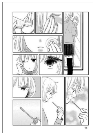
Gambar 2. Tokoh Yuuta sedang memakai kosmetik (Bokura no Hentai 2, 2012:119)

menyukai berdandan memakai kosmetik seperti pelembab wajah, bedak, mascara , dan lipstick , seperti data berikut.