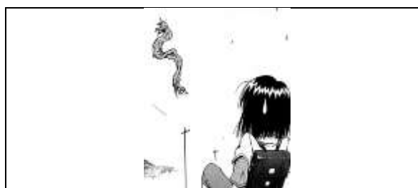
Gambar 2 . Perwujudan Shiro Uneri (Mokke vol 2, 2003:58)

Youkai yang berwujud benda dikenal dengan nama tsukumogami . Penggambaran mitos youkai yang berwujud benda terdapat dua youkai yaitu Shiro Uneri dan Jatai . Dari kedua youkai tersebut salah satunya adalah Shiro Uneri yang merupakan youkai berasal dari sebuah kain lap yang digunakan untuk bersih-bersih.