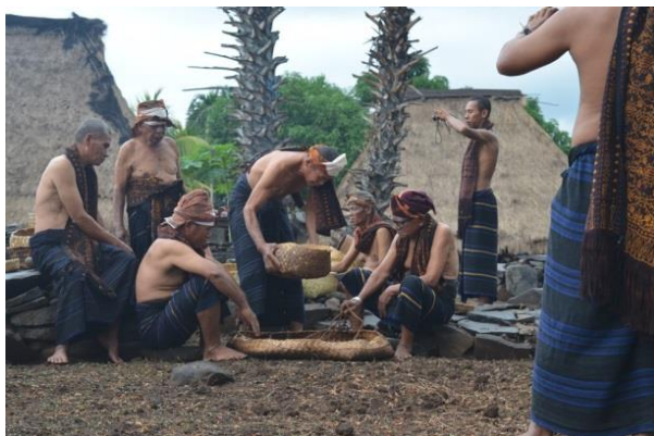
Gambar 1. Ritual Loka Lolo

Perilaku pertama yang diamati adalah pada saat dilaksanakan ritual Loka lolo (Gambar 1) yang merupakan upacara adat memetik jagung solor dengan membuang sorgum (sorgum muda digoreng kemudian ditumbuk) disepanjang pusat kampung ( nua one ) dan juga sebagai bukti kesadaran dan ketaatan loyalitas warga desa terhadap penguasa adat ( mosalaki ) dengan memberikan sekedar hasil kebun (satu wati ) untuk persembahan dan pemujaan kepada leluhur. Setiap kepala keluarga di Desa Nggela membawa jagung solor ke rumah asal (rumah-rumah adat yang berada di permukiman adat), kemudian di dalam rumah-rumah adat ini dikumpulkan menjadi satu wati besar kemudian dibawa ke Kanga Ria untuk dipersembahkan kepada yang pemberi makan dan kehidupan (Gambar 2). Setelah itu beberapa Mosalaki membawa jagung solor untuk ditebarkan di keliling permukiman adat mulai dari utara terlebih dahulu ke Kanga Loo lalu ke selatan dan di Sa'o Tana Tombu , kemudian kembali ke Kanga Ria . Setelah itu kembali ke selatan untuk duduk makan dan minum. Mosalaki dari Sa'o Tana Tombu memanggil Mosalaki lain di Kanga Ria untuk makan dan minum bersama. Selesai makan dan minum para Mosalaki kembali ke Kanga Ria untuk membagi-bagikan jagung solor/sorgum kepada masyarakat sesuai rumah-rumah adat.