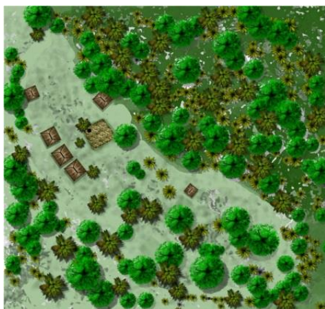
Gambar 8. Sejarah Permukiman Adat Setelah Dibangun Kanga Ria

Ketiga ritual yang telah dibahas sebelumnya dapat dilihat bahwa pusat dari aktivitas adat dilaksanakan di ruang luar yang berada di tengah permukiman adat. Ritual Loka Lolo , Joka Ju , dan Lobo Keda sebagian besar dilaksanakan di atas Kanga Ria seluruh ruang tengah pada permukiman adat ini (Gambar 8). Apabila dilihat dari faktor sejarah perkembangan permukiman adat yang mengarah ke selatan dengan membentuk sumbu axis dapat dipengaruhi oleh perilaku masyarakat dalam menjalankan ritual adat (Gambar 9). Hal ini dapat dilihat dari ruang di tengah-tengah permukiman adat dimana terdapat ketiga elemen sakral sebagai pusat orientasi perilaku masyarakat dalam ritual adat dan juga perilaku Mosalaki yang menjalankan ritual pada umumnya dari utara ke selatan.