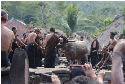
Gambar 4. Kerbau Digiring Keliling Kanga Ria

Setelah itu dimulai dengan ritual Tada Kamba yaitu persembahan kerbau, para Mosalaki membawa seekor kerbau ke atas Kanga Ria dan menarik kerbau yang diikat itu keliling Kanga Ria sebanyak 4 kali (Gambar 4). Setelah itu kerbau itu ditarik turun dari atas Kanga Ria kemudian digiring keliling kampung adat searah yang berlawanan jarum jam sambil memukul/membuat luka kerbau tersebut dengan parang. Sampai di Sa'o Keda yang terletak di selatan Kanga Ria , kerbau tersebut digiring mengelilingi Sa'o Keda sebanyak empat kali dan masih dengan arah yang berlawanan jarum jam (Gambar 5). Setelah itu kerbau tersebut dibawa ke tengah kampung adat dan dijatuhkan di atas sebuah batu ceper, kemudian dipotong lehernya sampai mati dan mulai memotong kerbau itu yang kemudian dibagi-bagikannya.