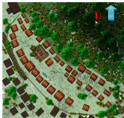
Gambar 9. Perkembangan Permukiman Adat

Pengaruh perilaku dalam ritual adat masyarakat dapat dilihat dalam ruang budaya yang terbentuk yaitu di tengah-tengah permukiman adat dimana terdapat Kanga Ria , Sa'o Keda , dan Puse Nua sebagai tiga elemen sakral sebagai wadah aktivitas ritual masyarakat. Perilaku masyarakat yang berpusat pada ruang tengah ini mempengaruhi arah hadap rumah-rumah adat dalam perkembangannya yaitu berorientasi ke tengah permukiman adat sehingga dapat dilihat adanya sumbu axis yang membagi deretan rumah adat ini.