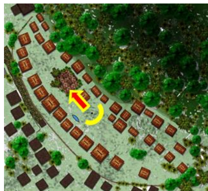
Gambar 7. Posisi Tarian Mure pada Permukiman Adat