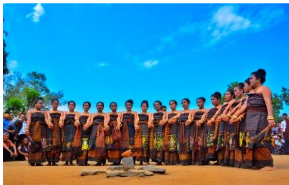
Gambar 6. Tarian Mure

menuju ke Tana li untuk gawi bersama sampai hari gelap. Gawi merupakan tarian kebersamaan yang dilakukan seluruh masyarakat.