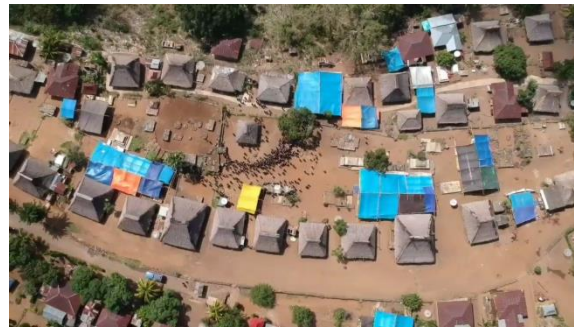
Gambar 5. Kerbau Digiring Keliling Sa'o Keda

Setelah upacara pemotongan kerbau, para penari Mure mulai keluar dari Sa'o Keda menuju Puse Nua (batu keramat sebagai titik pusat permukiman adat). Tarian Mure merupakan tarian sakral sebagai ucapan syukur dan juga tarian memanggil hujan (Gambar 6). Para penari ini membuat formasi setengah lingkaran di sebelah selatan Puse Nua dan mulai dengan nyanyian dan tarian (Gambar 7). Tarian yang mereka lakukan sambil mengelilingi Puse Nua . Selesai tarian Mure , nggo lamba (gong dan gendang) mulai dimainkan dan masyarakat mulai menari dan bersukacita setelah itu semua masyarakat, para mosalaki , dan penari mure beristirahat untuk makan siang. Setelah beristirahat dan makan siang, nggo lamba mulai dimainkan kembali dan masyarakat serta para Mosalaki