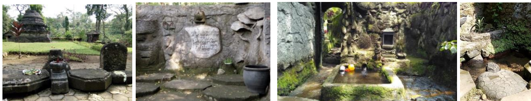
Gambar 3. (dari kiri ke kanan) Candi Sumberawan; bagian dalam bilik Kolam Amerta; Kolam Amerta; dan Kolam Sumber Penguripan