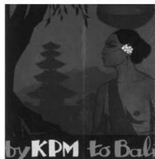
Gambar 2. Poster yang dibuat KPM untuk mempromosikan Bali

Bali Hotel dinyatakan dibuka dan dioperasikan oleh umum pada permulaan tahun 1942. Bali Hotel menjadi bagian dari rute perjalanan wisatawan pengguna jasa KPM, dikutip dari buku “Bali : Pariwisata Budaya dan Budaya Pariwisata” karya Michel Picard (1992) bahwa setelah mendarat di Buleleng menjelang matahari terbit, para wisatawan menyewa mobil berikut pemandu wisata dengan bantuan biro pariwisata. Para wisatawan diajak menyusuri jalan pantai, mereka menuju Bubunan di barat, lalu membelok ke pesanggrahan Munduk, tempat mereka dapat melanjutkan kunjungan ke daerah sekitar dengan berkuda ke Danau