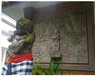
Gambar 6. Ragam hias tradisional Bali di Puri Agung