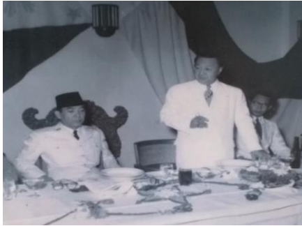
Gambar 9. Presiden Soekarno dan Presiden Filifina, Quirino dalam sebuah acara di Hotel Inna Bali