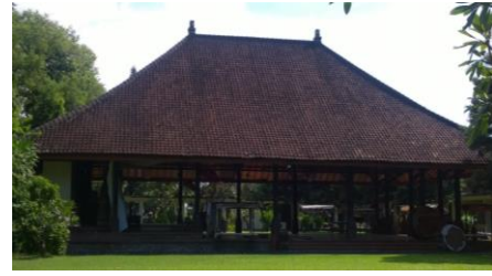
Gambar 8. Atap limas dengan kemiringan 45° di Pendopo Agung