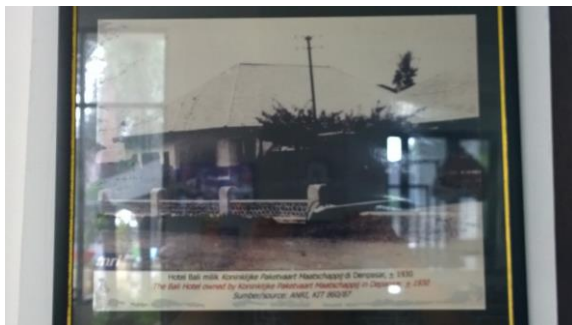
Gambar 1. Foto yang dipajang di lobi Hotel Inna Bali dengan jelas memberikan keterangan bahwa Hotel Inna Bali adalah milik KPM