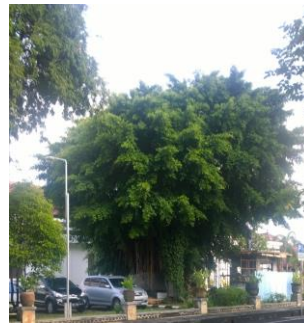
Gambar 10. Pohon beringin di halaman area barat Hotel Inna Bali