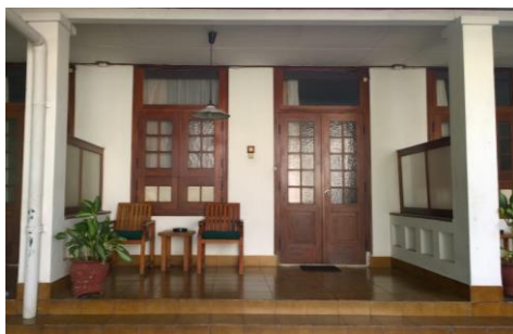
Gambar 3. Tampak muka teras di salah satu kamar di Hotel Inna Bali. Desain sederhana tanpa ornamen dan penggunaan cat berwarna putih