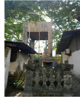
Gambar 11. Menara air

Hasil kajian nilai ilmu pengetahuan menunjukkan bahwa Hotel Inna Bali dapat memberikan informasi mengenai perkembangan ilmu pengetahuan di masanya melalui kehadiran teknologi yang digunakan dalam operasional hotel seperti teknologi kelistrikan, menara air setinggi \pm 4 meter di halaman belakangnya (Gambar 11) sebagai teknologi penyediaan air bersih, teknologi perpipaan, dan kotak surat “ Letterbox Brievenbus ” sebagai bentuk teknologi komunikasi. Pengaplikasian teknologi tersebut merupakan warisan budaya kebendaan/fisik ( tangible ).