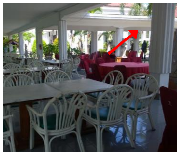
Gambar 4. Deretan tiang doric (ditunjukkan dengan tanda panah) di restoran Shinta