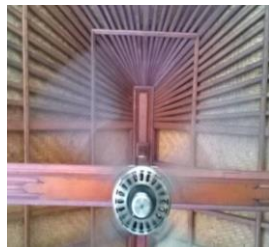
Gambar 7. Plafon restoran Taman Tirta yang terekspose