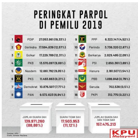
Gambar 4.2.1 Perolehan Suara Parnpol pada Pemilu Legislatif 2019