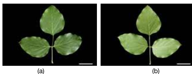
Gambar 1. Karakteristik daun kacang pedang (a). Daun bagian adaksial dan (b) daun bagian abaksial.

Di Indonesia, kacang pedang dapat dijumpai di berbagai daerah, terutama di Jawa melalui catatan dari Backer & v.d. Brink (1963). Secara umum, karakteristik morfologis kacang pedang di Bali dengan Jawa tidak berbeda secara kualitatif. Kacang pedang memiliki habitus berupa tumbuhan merambat perennial dengan pertumbuhan batang sekitar 3–10 m. Karakteristik daun kacang pedang (Gb. 1a-b) berupa daun majemuk beranak daun 3 (trifoliate), bagian adaksial berwarna hijau dan bagian abaksial berwarna hijau pucat, helaian berbentuk bulat telur–oval, berukuran 11,2–17,5 × 9,1–12,8 cm, tepi rata–bergelombang, ujung runcing–meruncing pendek, pangkal daun runcing, panjang tangkai daun 0,7–1 cm, panjang ibu tangkai daun 9,5–20,2 cm, memiliki sayap di bagian ventral.