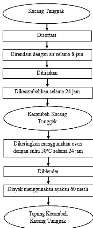
Gambar 2. Proses pembuatan tepung kecambah kacang tunggak (Ningsih, 2007 yang dimodifikasi)

Proses pembuatan kecambah kacang tunggak diawali dengan sortasi kacang tunggak, kemudian direndam dengan air selama 8 jam, ditiriskan, dan diletakkan di dalam keranjang plastik yang bagian bawah telah dilapisi daun pisang, lalu ditutup dengan daun pisang pada bagian atas dan dikecambahkan selama 24 jam. Kecambah kacang tunggak kemudian dikeringkan menggunakan oven dengan suhu 50°C selama 24 jam, kemudian diblender dan diayak menggunakan ayakan 60 mesh. Adapun proses pembuatan tepung kecambah kacang tunggak dapat dilihat pada Gambar 2.