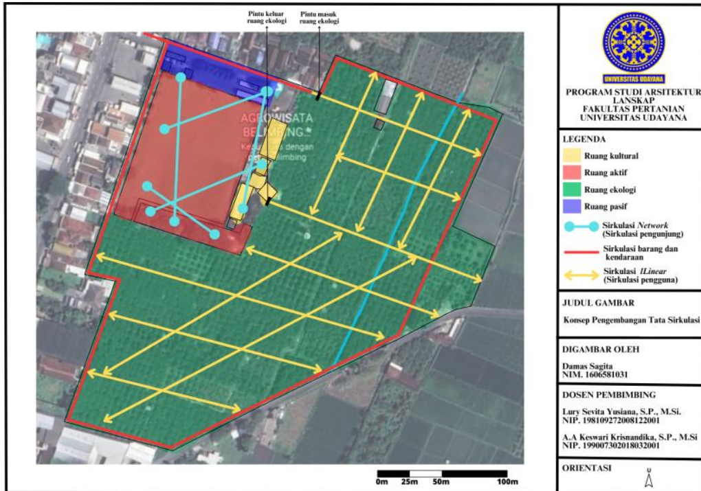
Gambar 2. Konsep Pengembangan Tata Sirkulasi