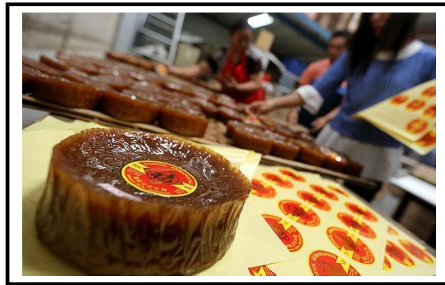
Gambar 3. Ilustrasi aktifitas pembuatan olahan belimbing

Pembuatan olahan dari buah belimbing disini bertujuan untuk meminimalisir banyaknya buah belimbing yang busuk dan berakhir dibuang. Pengunjung bisa melihat proses pembuatan oleh-oleh yang ada, bahkan ikut membuat olahan tersebut (Ilustrasi Gambar 3). Olahan yang direkomendasikan berupa makanan serta minuman yang berasal dari buah belimbing. Beberapa jajanan khas Kota Blitar yang dapat dibuat dari bahas dasar buah belimbing yaitu wajik kletik, keripik belimbing, sirup sari belimbing, dan beberapa makanan lainnya.