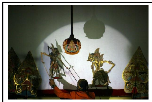
Gambar 5. Ilustrasi aktifitas wayang

Penambahan pertunjukan seni budaya lokal dapat dijadikan sebagai selingan pertunjukan live music . Penambahan pertunjukan ini bertujuan untuk mengenalkan seni budaya lokal Kota Blitar kepada masyarakat luas. Selain itu, dengan adanya pertunjukan seni budaya lokal diharapkan pengunjung dapat menikmati waktu santainya dengan menikmati makanan diselingi dengan melihat pertunjukan tersebut. Salah satu seni budaya lokal Kota Blitar yakni pertunjukan wayang yang dapat dilihat pada ilustrasi Gambar 5.