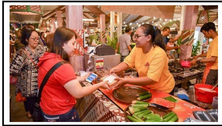
Gambar 43. Ilustrasi aktifitas kuliner makanan lokal

makanan khas yang dapat disajikan yakni nasi ampok yang berasal dari jagung, cceng goreng, tahu bumbu lawu, dan yang lainnya.