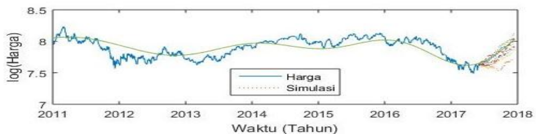
Gambar 3. Grafik Logaritma Harga dengan Musiman Kakao 03 Januari 2011 sampai 31 Mei 2017 dan Simulasi Logaritma Harga Model Mean Reversion dengan Musiman Kakao

Penentuan nilai kontrak opsi call tipe Eropa, diperoleh dengan mensubstitusi harga S_T yang merupakan harga komoditas saat jatuh tempo kakao selama 3 bulan dengan nilai K, r dan T yang sudah ditentukan ke dalam persamaan (3). Selanjutnya, nilai yang diperoleh dirata-ratakan sehingga, nilai opsi call dari komoditas kakao Pada Tabel 4 memperlihatkan nilai kontak opsi call tipe Eropa dengan jumlah simulasi 10 kali, 100 kali, 1.000 kali, 10.000 hingga 100.000 kali dengan menggunakan bantuan program Matlab.