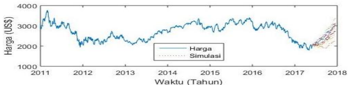
Gambar 4. Grafik Harga dengan Musiman Kakao 03 Januari 2011 sampai 31 Mei 2017 dan Simulasi Harga Model Mean Reversion dengan Musiman Kakao selama 7 Bulan