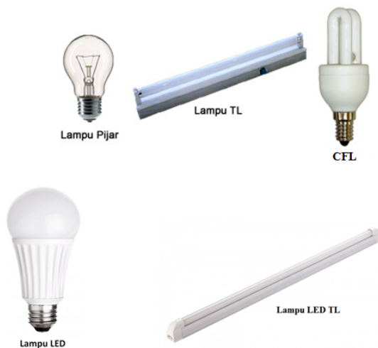
Gambar 1: Jenis-Jenis Lampu

Hasil pengujian lampu LED sebanyak 59 unit yang dipasarkan di Indonesia menunjukkan bahwa semua sampel yang diuji masih tetap dapat menyala dengan baik walaupun mengalami penurunan kuat cahayanya rata-rata sebesar 16,9% setelah dinyalakan 6000 jam cahaya awal. Hasil pengujian juga menunjukkan terdapat 57 unit lampu (96,6%) dari 59 unit lampu masih mampu mengeluarkan kuat cahaya di atas 50% dari kuat cahaya awal. Atau 89,8% lampu yang diuji masih mampu menghasilkan kuat cahaya di atas 70% setelah dinyalakan 6000 jam. Dengan cara ekstrapolasi didapatkan bahwa lampu tersebut mempunyai life time rata-rata sekitar 20.500 jam [2].