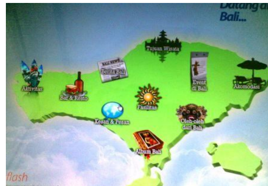
Gambar 3. Fitur e-Kios destinasi pariwisata Bali

Gambar 3. adalah visualisasi dari fitur-fitur informasi destinasi pariwisata yang disajikan dalam e-Kios. Mayoritas wisatawan memberikan respon yang cukup yaitu 58 responden (63.0%), 27 responden (28,3%) berpendapat baik, dan sebanyak 7 responden (7,6%) berpendapat bahwa fitur-fitur tersebut masih buruk.