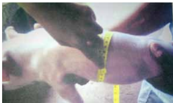
Gambar 2. Pengukuran Lingkaran Tubuh