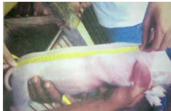
Gambar 1. Pengukuran Panjang Tubuh

Pengukuran panjang tubuh dilakukan dengan cara mengukur dari bagian anterior vertebrae cervicales primum sampai tuber sacrale dengan menggunakan meteran, lingkaran tubuh diukur dengan cara melingkari region vertebrae lumbales primum (Getty, 1985)