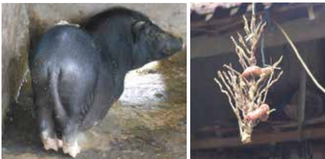
Gambar 2. Babi bali dan urutan (makanan khas daging babi)

Mencermati menurunnya perkembangan peternakan babi bali di Kabupaten Gianyar dan semakin banyaknya berdiri rumah makan yang menyediakan babi guling maka ternak babi bali memiliki kesempatan untuk dikembangkan dan ditingkatkan kapasitasnya sebagai salah satu plasma nutfah yang sangat menjanjikan. Berbagai upaya perlu dilakukan untuk meningkatkan kesadaran dan keberpihakan masyarakat peternak untuk memilih babi bali untuk dikembangkan. Disisi lain peningkatan promosi dan informasi ilmiah tentang guling babi bali sangat diperlukan agar “guling babi bali dapat berceritera tentang dirinya sendiri”.