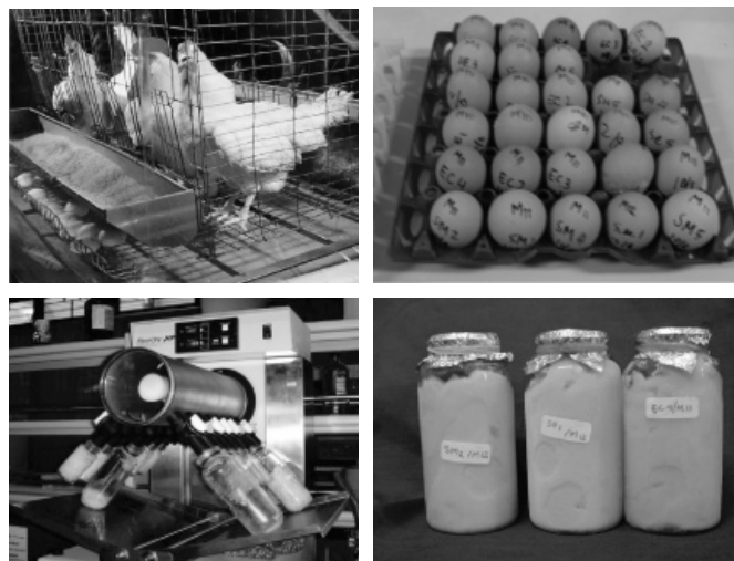
Gambar 1. Ayam petelur yang disuntik dengan antigen tertentu ( Escherichia coli , Salmonella sp. dan Streptococcus mutans ), telur utuh mengandung antibodi spesifik, preparasi kuning telur dan kemasan kuning telur yang bisa diolah untuk berbagai tujuan.

Pemanfaatan telur ayam sebagai pabrik biologis sangat selaras dengan isu global saat ini tentang “ Animal Welfare ”. Dalam produksi bahan biologis telur dapat menggantikan hewan, misalnya dalam produksi anti tetanus serum (ATS), hingga saat ini masih digunakan serum kuda. Untuk memproduksi ATS kuda harus disuntik berkali-kali dengan toksoid tetanus dan pada saat panen serum dilakukan juga berulang-ulang pada