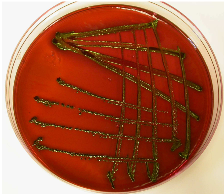
Gambar 1 Koloni kuman yang ditanam pada media EMBA

Sampel feses dari anak babi yang menunjukkan mencret warna putih yang ditanam pada EMBA secara dominan tampak koloninya berwarna gelap dengan kilat logam. Koloni yang berwarna gelap disertai dengan kilat logam patut dicurigai sebagai E. coli .