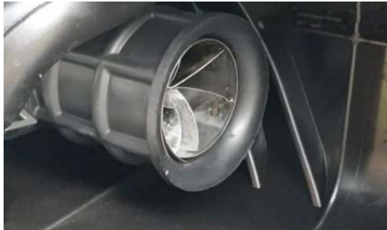
Gambar 1. Penempatan jet ranger pada kendaraan.