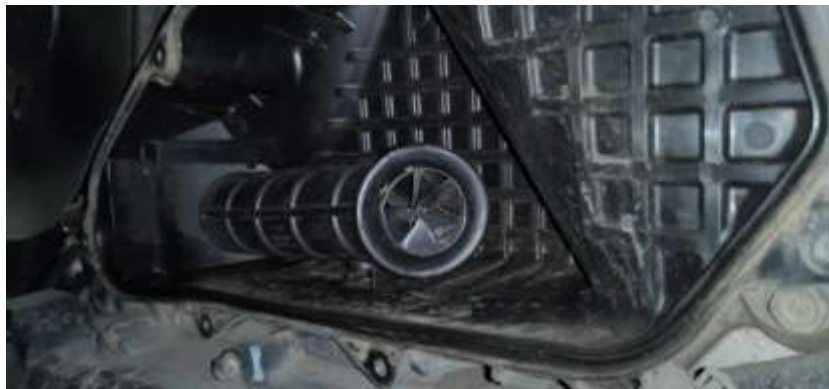
Gambar 3. Penempatan jet ranger pada sepeda motor Honda Vario 150 cc

Jet ranger memiliki fungsi untuk meningkatkan turbulensi udara yang masuk melewati saluran masuk udara pada sepeda motor Honda Vario 150 cc. Jet ranger di tempatkan setelah filter udara, lebih jelasnya disajikan pada Gambar 3. Setelah jet ranger dipasang pada saluran udara masuk setelah filter udara, filter udara dipasang kembali. Kemudian, dilakukan pengujian torsi dan daya menggunakan chassis dynamometer untuk mengetahui performa yang dihasilkan. Pengujian torsi dan daya dilakukan menggunakan standar SAE J1349 [12]. Dokumentasi pengujian disajikan pada Gambar 4.