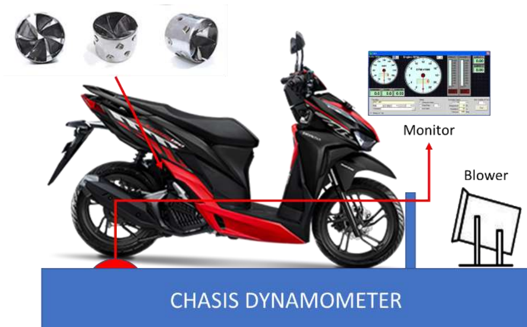
Gambar 2. Instrumen penelitian.