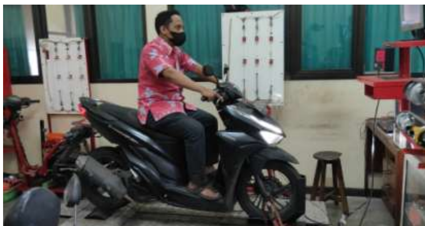
Gambar 4. Pengujian torsi dan daya menggunakan chassis dynamometer

Pengujian torsi dan daya dilakukan sampai mendapatkan data sebanyak 3 data torsi dan daya yang memiliki nilai sama atau hampir sama. Hal ini dilakukan agar data valid dan reliabel menggambarkan data torsi dan daya yang sebenarnya dihasilkan oleh sepeda motor. Hasil pengujian torsi dan daya sepeda motor Honda Vario 150 cc disajikan Tabel 2.