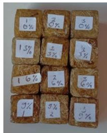
Gambar 2. Spesimen uji biodegradasi

Resin getah pinus didapat dari penyadapan pohon pinus di kawasan KPH Bali timur, resin epoxy tipe lycal 1011 dengan perbandingan 90% : 0%, 87% : 3%, 84% : 6%, 81% : 9%, kedua resin akan dipanaskan dengan magnetic stirrer pada suhu 170°C, dengan kecepatan putaran 400 Rpm selama 45 menit, dengan holding time selama 1 jam. Didapatkan spesimen uji seperti pada gambar 2