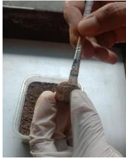
Gambar 5. Proses pembersihan spesimen setelah ditanam 7 hari

Untuk menghitung nilai pengurangan massa spesimen uji perhari digunakan persamaan sebagai berikut;