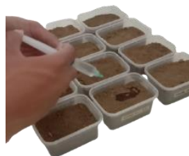
Gambar 4. Pemberian air sebanyak 20 ml pada media tanah

Media tanah diberi air bersih 20 ml setiap 3 hari sekali untuk mendukung perkembangan mikroorganisme dalam tanah, seperti pada gambar 4