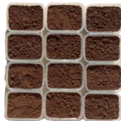
Gambar 3. Media tanah uji biodegradasi

Pengujian dilakukan dengan metode soil burial test (spesimen ditanam dalam tanah), selama 60 hari, media tanah yang digunakan didapatkan di daerah kebun utara, pengukuran pH, kelembaban, dan cahaya dilakukan dengan menggunakan alat 3 way soil meter . Pada penelitian ini pH, kelembaban, dan cahaya diasumsikan konstan. Pengujian dilakukan dalam wadah thinwall dengan ukuran 30cm x 20cm x 8cm seperti gambar 3 dibawah ini,