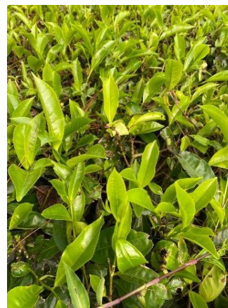
Gambar 1. Klon teh di area perkebunan PPTK.

Teh hijau yang digunakan adalah klon tipe sinensis dari PPTK, Gambung, Ciwidey. Klon teh ini berusia sekitar 28 tahun dimana sudah ditanam di perkebunan PPTK sejak tahun 1994. Bagian teh yang diambil adalah pucuk segar (P+3). Sebanyak 10 kg pucuk teh diproses dengan metode steaming pada suhu 100°C selama 2.5 menit (Trinovani et al. , 2022)