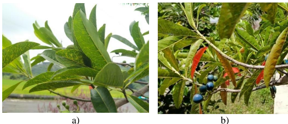
Gambar 1. Tumbuhan genitri. a) Daun genitri tersusun selang-seling dengan pertulangan daun menyirip dan permukaannya halus; b) Buah genitri matang berwarna biru keunguan, struktur keras.

Tumbuhan genitri merupakan salah satu tumbuhan lokal Indonesia yang diketahui memiliki banyak kandungan senyawa dengan manfaat baik bagi kesehatan tubuh. Kompleks senyawa yang terkandung dalam daun, buah/biji antara lain geranin, 3-4-5 trimetoksi geranin, grandisinin, quercetin , alkaloid, glikosida, saponin, fenolik, fitosterol, flavonoid, dan tanin (Singh et al. , 2015; Tripathy et al. , 2016). Kulit buah genitri mengandung senyawa alkaloid, flavonoid, antosianin, tanin, fenol, dan saponin yang diketahui berpotensi sebagai bahan antioksidan (Hardainiyani, et al. , 2015; Miao et al. , 2016). Tumbuhan genitri dapat dilihat pada Gambar 1. Bahan alam sebagai agen antioksidan dan antimikroba alami dapat dikembangkan menjadi obat yang lebih aman daripada obat sintetik (Verma, 2017). Kandungan fitokimia tumbuhan genitri seperti pada Tabel