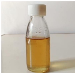
Gambar 2. Minyak Atsiri Daun Cengkeh

Warna minyak atsiri daun cengkeh sesuai SNI-06-2387-2006 adalah kuning hingga coklat tua. Pada Gambar 2 ditunjukkan bahwa hasil minyak atsiri daun cengkeh yang diperoleh berwarna kuning.