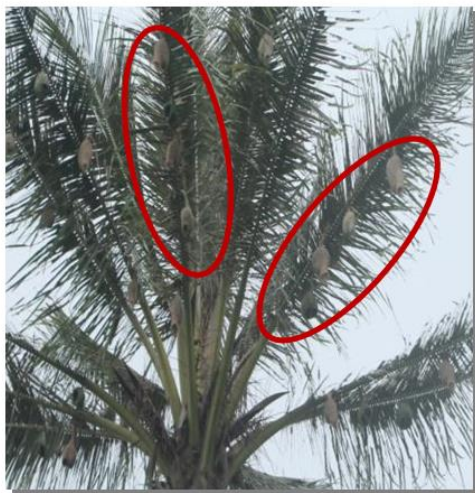
Gambar 2. Posisi sarang tempua di pelepah pohon kelapa ( Cocos nucifera ).

Bagian pohon yang digunakan burung tempua untuk membuat sarang yaitu pada bagian pelepah. Pada satu pelepah dapat dibangun 3 sampai 5 buah sarang. Sarang lebih banyak dibangun pada pelepah bagian bawah karena pada posisi ini pelepah kelapa memiliki lengkungan yang lebih besar dan kuat untuk dibangun sarang. Sarang yang paling banyak ditemukan yaitu sarang lengkap yang telah memiliki chamber . Pelepah yang tebal dapat memberikan kestabilan pada sarang saat angin kencang. Posisi sarang burung tempua yang tergantung di tengah pelepah daun kelapa sangat menguntungkan bagi burung tempua, karena sarang akan ternaungi ketika hujan ataupun angin kencang. Hal ini diperkuat dengan pendapat Ali (1931) dan Davis (1971)