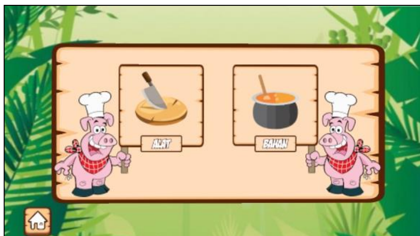
Gambar 4. Tampilan Menu Alat & Bahan

Gambar 3(a) merupakan tampilan dari Menu Animasi yang menampilkan pilihan tentang bagian dari beberapa proses pembuatan babi guling. Gambar 3(b) memperlihatkan bagaimana antar muka animasi 3D dari salah satu proses pengolahan babi guling. Tombol informasi digunakan untuk menampilkan informasi dari penjelasan proses salah satu dari pengolahan babi guling. Tombol video digunakan untuk menampilkan video nyata dari salah satu proses pengolahan babi guling.