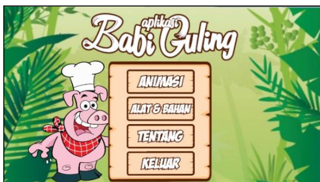
Gambar 2. Tampilan Menu Utama

Aplikasi pengolahan babi guling diawali dengan Tampilan Menu Utama. Pada tampilan Menu Utama disajikan empat menu pilihan, yaitu Menu Animasi, Menu Alat&Bahan, Menu Tentang dan Menu Keluar. Tampilan awal Halaman Menu Utama ditampilkan pada Gambar 2.