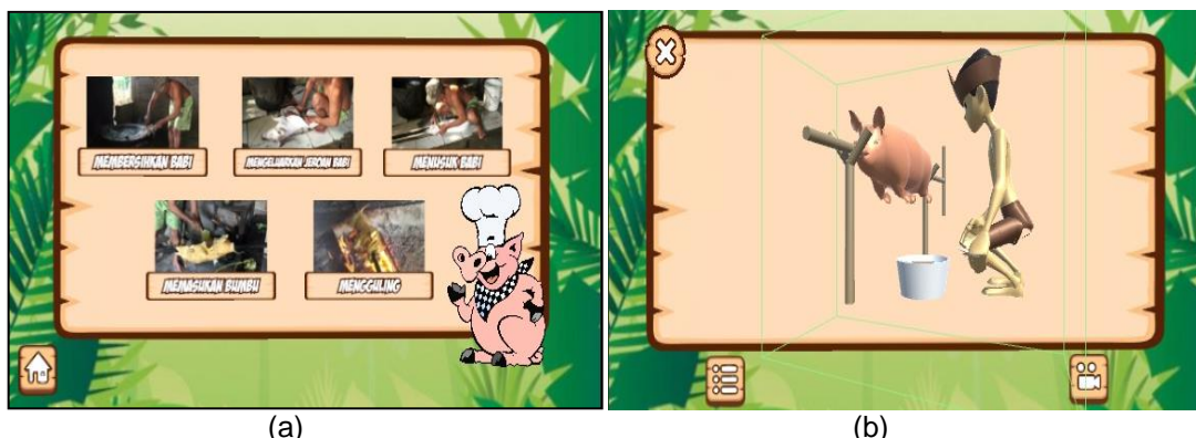
Gambar 3. Tampilan Menu Animasi: (a) Menu Animasi; (b) Tampilan Animasi 3D

aplikasi dan yang membuat aplikasi. Menu Keluar menampilkan pilihan mengakhiri atau melanjutkan menggunakan aplikasi.