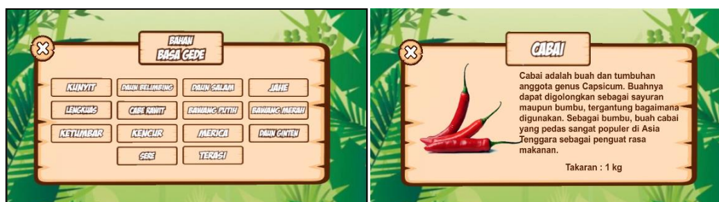
Gambar 6. Tampilan Menu Bahan

Gambar 5 memperlihatkan halaman Menu Alat yang menampilkan gambar dan informasi mengenai kegunaan dari alat yang digunakan dalam proses pengolahan babi guling. User dapat memilih gambar alat yang terdapat pada Menu Alat untuk menampilkan gambar serta informasi dari kegunaan alat. Tombol X yang terdapat pada pojok kiri atas informasi Alat digunakan untuk kembali ke Halaman Menu Alat.