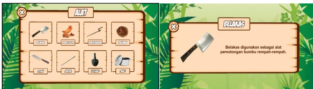
Gambar 5. Tampilan Menu Alat

Gambar 5 memperlihatkan halaman Menu Alat yang menampilkan gambar dan informasi mengenai kegunaan dari alat yang digunakan dalam proses pengolahan babi guling. User dapat memilih gambar alat yang terdapat pada Menu Alat untuk menampilkan gambar serta informasi dari kegunaan alat. Tombol X yang terdapat pada pojok kiri atas informasi Alat digunakan untuk kembali ke Halaman Menu Alat.