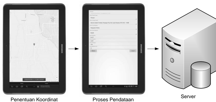
Gambar 3. Penentuan Koordinat dan Pendataan untuk Bangunan Irigasi

Aplikasi ini menentukan koordinat untuk Bangunan Irigasi dan Jaringan Irigasi. Kedua penentuan koordinat ini sama-sama menggunakan GPS, namun untuk pendataan Bangunan dan Jaringan Irigasi sedikit memiliki perbedaan. Penentuan koordinat untuk Bangunan Irigasi dilakukan dengan berada langsung pada bangunan yang akan dipetakan, pengguna akan menjalankan aplikasi dan mengaktifkan fitur GPS untuk menentukan posisi dan mendapatkan koordinat dari Bangunan Irigasi, setelah koordinat didapatkan maka pendataan dilakukan untuk memberikan informasi yang berhubungan dengan Bangunan Irigasi yang akan dipetakan tersebut untuk disimpan pada server . Proses Penentuan koordinat dan Pendataan dari Bangunan Irigasi dapat dilihat pada Gambar 3.