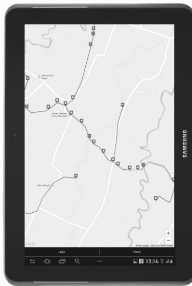
Gambar 2. Tampilan Peta pada Aplikasi Pemetaan Bangunan dan Jaringan Irigasi

Aplikasi ini adalah aplikasi geografis untuk memetakan Bangunan dan Jaringan Irigasi sehingga aplikasi ini juga mampu untuk menampilkan peta beserta posisi Bangunan dan Jaringan Irigasi pada peta digital seperti yang terlihat pada gambar 2.