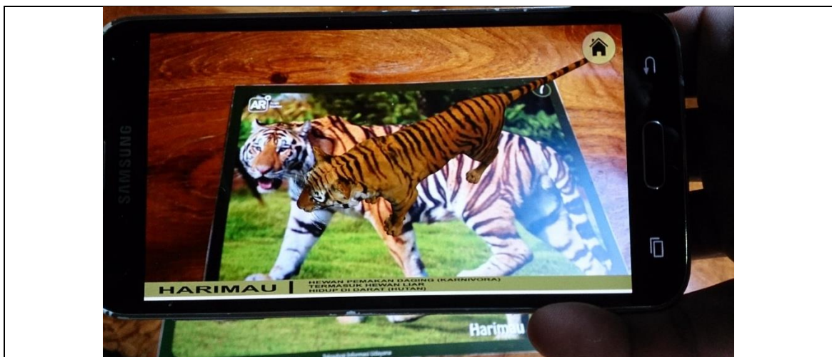
Gambar 4. Scene Kamera AR

Scene Kamera_AR merupakan Scene utama dari aplikasi ini, pada Scene inilah objek 3 dimensi dan suara dari Binatang ditampilkan ketika kamera Smartphone diarahkan ke marker . Gambar 4 adalah tampilan dari Scenekamera_AR :