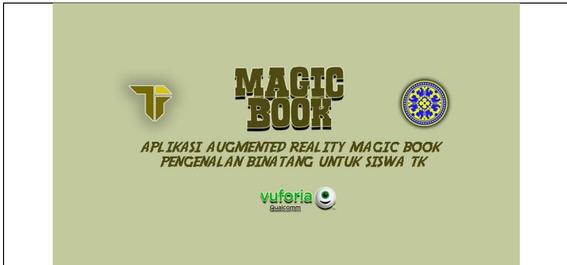
Gambar 2. Scene Spalshscreen

Scene Splash Screen merupakan tampilan awal saat membuka Aplikasi Augmented Reality Magic Book Pengenalan Binatang untuk Siswa TK sebelum masuk ke Scene MainMenu . Gambar 2 menunjukkan tampilan dari Scene SplashScreen .