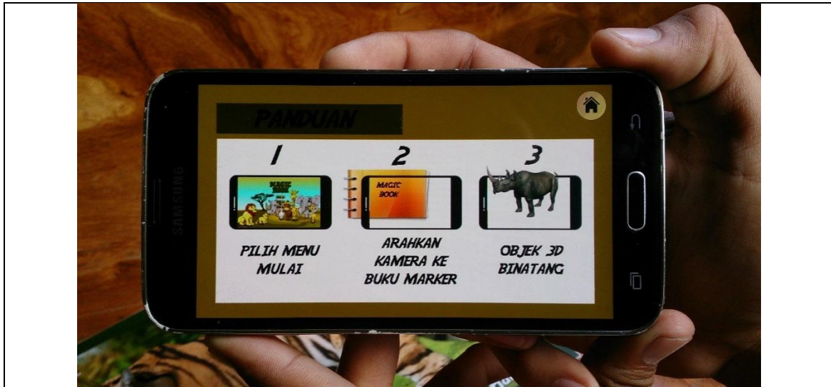
Gambar 5. Scene Panduan