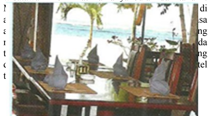
Gambar 3 Headline DI 1

kolam renang terdapat tulisan “ Bari de Ichiban no Hoteru Desu ”. Pada bagian headline iklan terkadung tanda ikonis.. Selain itu, unsur nonverbal ini mengacu pada tanda ikonis yang menjadi ikon taman hotel lengkap dengan kolam renang dan hotel yang dekat dengan pesisir pantai. Unsur verbal yang mendukung unsur nonverbal ini berupa pernyataan “ doko made mo tsutsuku bakusa no sanuru bichi, nagai nentsuki o kanji saseru kikigi ni kakomareta teire no ikitodoita gaaden nado ” yang dapat diartikan ‘Pantai Sanur dengan pasir putihnya mengitari, taman yang dikemas dengan cermat dikelilingi pepohonan yang dapat membuat wisatawan menikmati lamanya bulan dan tahun’.