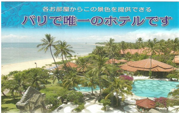
Gambar 4 Body Copy DI 1

tambahan terhadap headline iklan. Pada iklan ini body copy direpresentasikan melalui tanda verbal sebagai berikut.