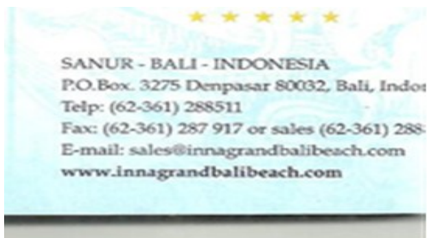
Gambar 10 Standing Details DI 1

Standing details yang ditampilkan pada iklan gambar 10 DI 1 hampir sama dengan iklan hotel yang lain, yaitu berisi alamat hotel lengkap dengan nomor telepon. Selain itu, juga alamat website dan email yang lebih memudahkan para tamu ataupun agen perjalanan dalam memesan kamar hotel ataupun untuk mengetahui fasilitas hotel dan harga hotel tersebut. Tanda simbol yang ditampilkan pada iklan ini adalah logo dari Hotel Inna Grand Bali Beach itu sendiri. Logo tersebut merupakan penanda dari Hotel Inna Grand Bali Beach.