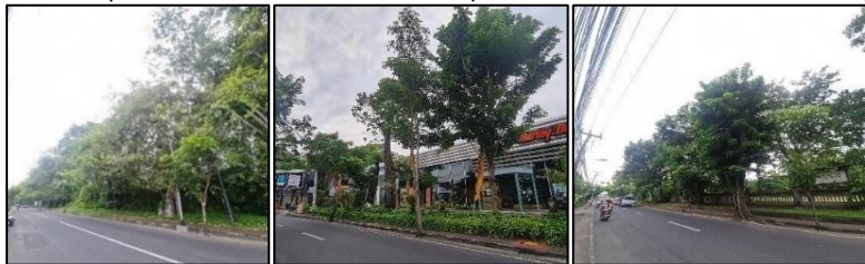
d. Foto lanskap 4