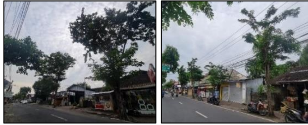
d. Foto Lanskap 6