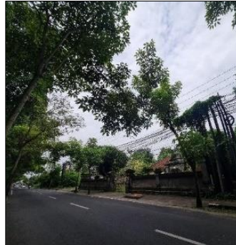
Gambar 3. Foto lanskap 4 pada segmen 2, kelompok pohon sejenis yang masuk dalam kategori nilai estetika rendah

Nilai Estetika Rendah. Foto lanskap yang termasuk kedalam kategori nilai estetika rendah yaitu foto lanskap 4 yang terletak pada segmen 2. Deretan pohon T. impetiginosa yang terlihat pada Gambar 3 (foto lanskap 4) terlihat masih muda dengan pertumbuhan yang tidak merata, tajuknya belum sempurna tidak rimbun dan tidak ada keseragaman tajuk, serta memiliki tinggi dan jarak tanam yang tidak sama antar pohon. Hal ini membuat bentuk arsitektural yang tidak proporsional sehingga tidak terjadi pengulangan ( repetition ) untuk mencapai kesatuan ( unity ). Untuk menghasilkan taman yang ideal perlu penerapan prinsip desain seperti unity , balance , rhythm , dan emphasis terhadap elemen lanskap sehingga dicapai komposisi yang harmonis (Reid, 1993).