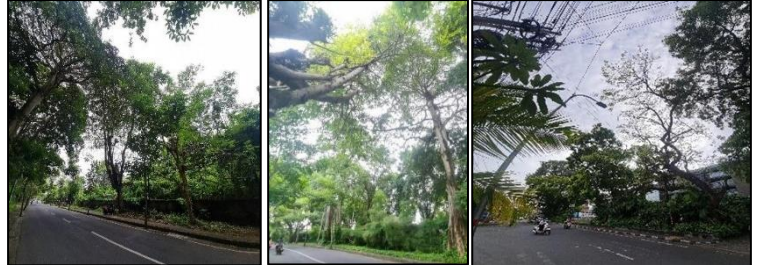
a. Lanskap 1

Nilai Estetika Sedang. Kategori nilai estetika sedang, terdapat pada foto lanskap 1, 3, 4, 5, 6, 8. Pada Gambar 7 (foto lanskap 1, 2, 3, 4, 5, dan 6) yang terletak pada segmen 1, 2, 3 terlihat kombinasi pohon dengan perbedaan umur yang sangat jauh, pohon dewasa memiliki ketinggian yang cukup tinggi dan bentuk tajuk yang sempurna. Namun diselingi oleh pohon muda yang tingginya belum ideal dan bentuk tajuk yang belum sempurna. Hal ini menyebabkan kurang adanya keharmonisan antar pohon dari bentuk tajuk, tinggi, dan percabangan. Menurut Austin (1982) keragaman jenis pohon dengan bentuk arsitektural yang berbeda - beda tetapi dalam kondisi yang harmonis akan menampilkan visualisasi yang memenuhi aspek keindahan.