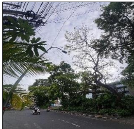
Gambar 8. Foto lanskap 8 pada segmen 4, kelompok pohon campuran yang masuk dalam kategori nilai estetika tinggi

Nilai Estetika Tinggi. Foto lanskap yang termasuk kedalam kategori nilai estetika tinggi adalah foto lanskap 8 pada segmen 4 (Gambar 8). Terlihat kombinasi beberapa pohon dewasa A. scholaris dan A. indica dengan jarak tanam rapat, memiliki bentuk cabang dan tajuk yang beragam dan saling bersinggungan, menyatu secara harmonis sehingga membentuk visual yang sangat indah. Keragaman jenis pohon dengan bentuk arsitektural yang berbeda-beda tetapi dalam komposisi yang harmonis akan menampilkan visualisasi yang memenuhi aspek keindahan (Austin, 1982).