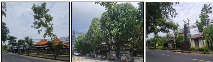
a. Foto lanskap 1