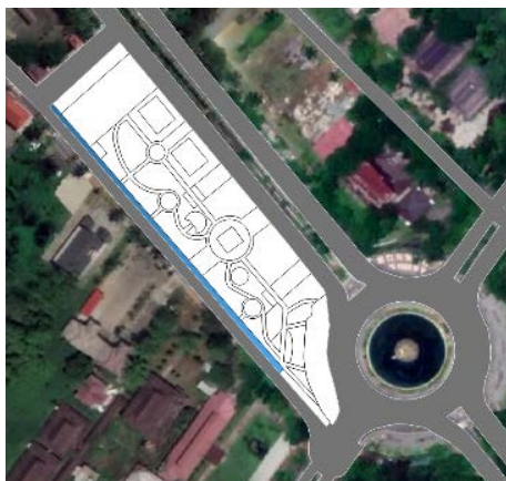
Gambar 3. Lokasi Tipologi Parkir

Pada Taman Catur Ayani sudah terdapat lokasi yang berfungsi sebagai parkir. Parkir memiliki 3 (tiga) kategori aktivitas, yaitu: ekonomi, ekologis, dan arsitektural. Fungsi utama parkir termasuk dalam kategori ekonomi. Pada lokasi ini, sudah terdapat parkir untuk sepeda dan kendaraan bermotor. Parkir yang terdapat pada taman ini baru memiliki fungsi pelengkap arsitektural. Pada taman ini dilengkapi ornamen yang berfungsi fungsional dan estetis dapat dilihat pada gambar 6. Sedangkan untuk fungsi ekologis belum terlihat pada taman ini. Hal ini disebabkan belum terdapat berbagai jenis vegetasi pendukung.