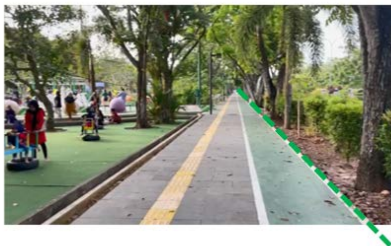
Gambar 9. Taman Catur Ayani sebagai Pembatas