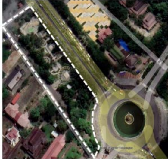
Gambar 1. Ruang Lingkup Wilayah

di perkotaan adalah pendekatan kualitatif. Teknik pengumpulan data menggunakan pengumpulan data primer dengan observasi langsung. Informasi obyektif tentang pengguna taman dapat diperoleh melalui alat pengamatan langsung (van Hecke et al., 2017). Observasi dilakukan pada aktivitas pengunjung Taman Catur Ayani. Observasi dilakukan untuk mengetahui gambaran tipologi di Taman Catur Ayani Kota Pontianak. Taman kota mendukung aktivitas fisik melalui aksesibilitasnya; ketentuan mereka untuk memfasilitasi kegiatan aktif; kapasitas mereka untuk memberikan peluang bagi berbagai pengguna (McCormack et al., 2010)