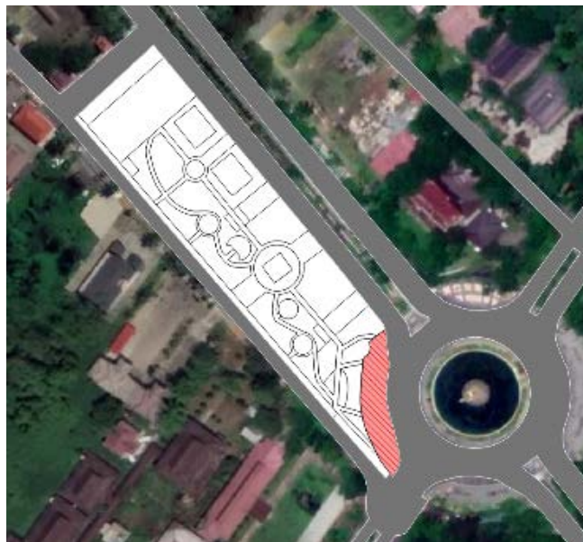
Gambar 2. Lokasi Tipologi Plasa

Plasa merupakan bentuk ruang terbuka tempat berkumpulnya masyarakat untuk melakukan aktivitas tertentu. Pada Taman Catur Ayani terdapat lokasi yang berfungsi sebagai plasa. Plasa berada dekat dengan Bundaran Digulis di Jl. Ahmad Yani dan berdampingan dengan fasilitas pendidikan. Gambar 2 menunjukkan lokasi tipologi plasa.