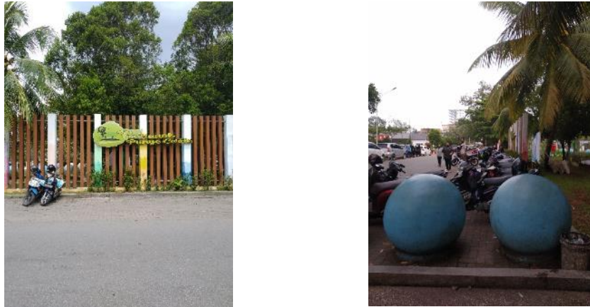
Gambar 5. Fungsi Arsitektural pada Parkir Taman Catur Ayani