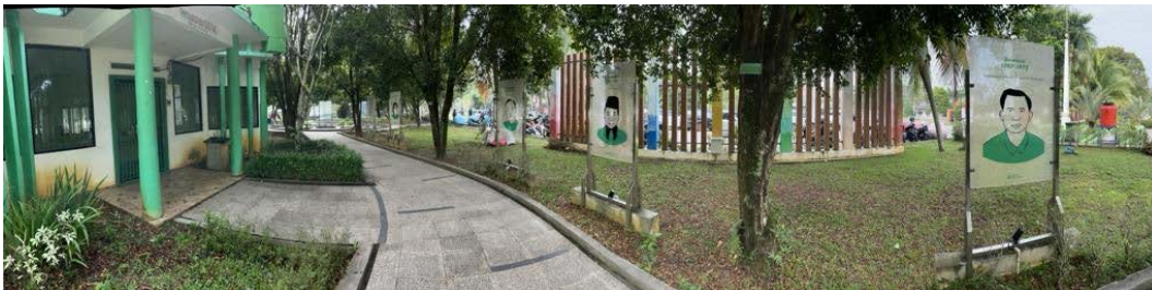
Gambar 10. Fungsi Arsitektural untuk Koridor di Taman Catur Ayani

Koridor memiliki fungsi utama sebagai sarana pejalan kaki. Pada koridor Taman Catur Ayani terdapat fungsi arsitektural misalnya dengan melengkapi area koridor dengan berbagai ornamen fungsional ataupun estetis berupa papan informasi mengenai sejarah kepemimpinan Pontianak di koridor taman.