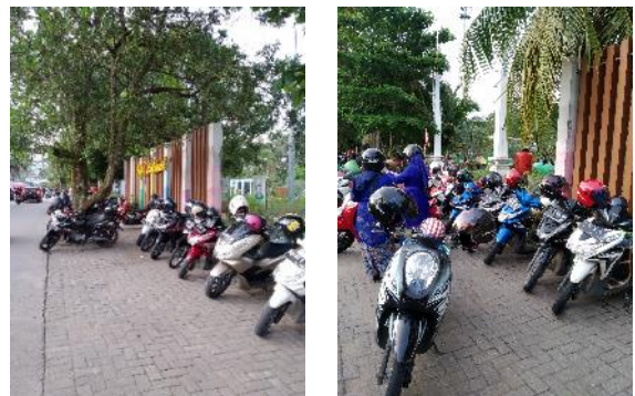
Gambar 4. Kondisi Parkir di Taman Catur Ayani