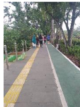
Gambar 8. Penggunaan Lahan di Sekitar Taman Catur Ayani