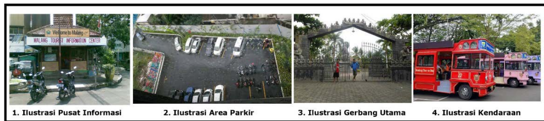
Gambar 3. Ilustrasi Fasilitas