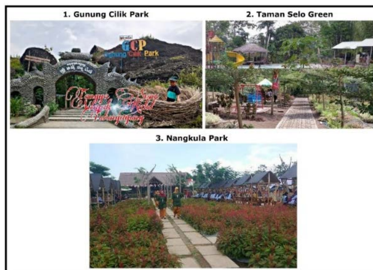
Gambar 2. Daya Tarik Wisata Pendukung

Berdasarkan data inventarisasi Kawasan Pegunungan Selatan memiliki potensi wisata sejarah disertai dengan daya tarik wisata pendukung sebagai pelengkap. Beberapa daya tarik wisata yang memiliki daya tarik wisata pendukung yakni Candi Dadi dengan Gunung Cilik Park, Candi Gayatri dengan Nangkula Park, dan Goa Selomangleng dengan Taman Selo Green (Gambar 2.).