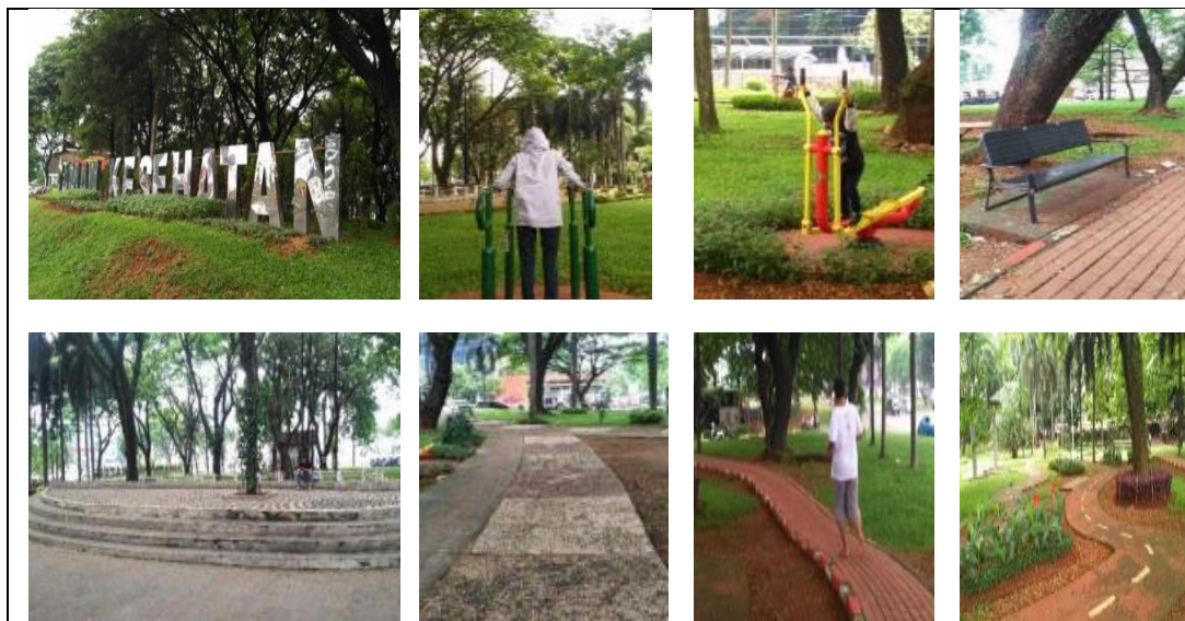
Gambar 3 Pemanfaatan Fasilitas dan Suasana Taman Kesehatan (Dinda, 2020)