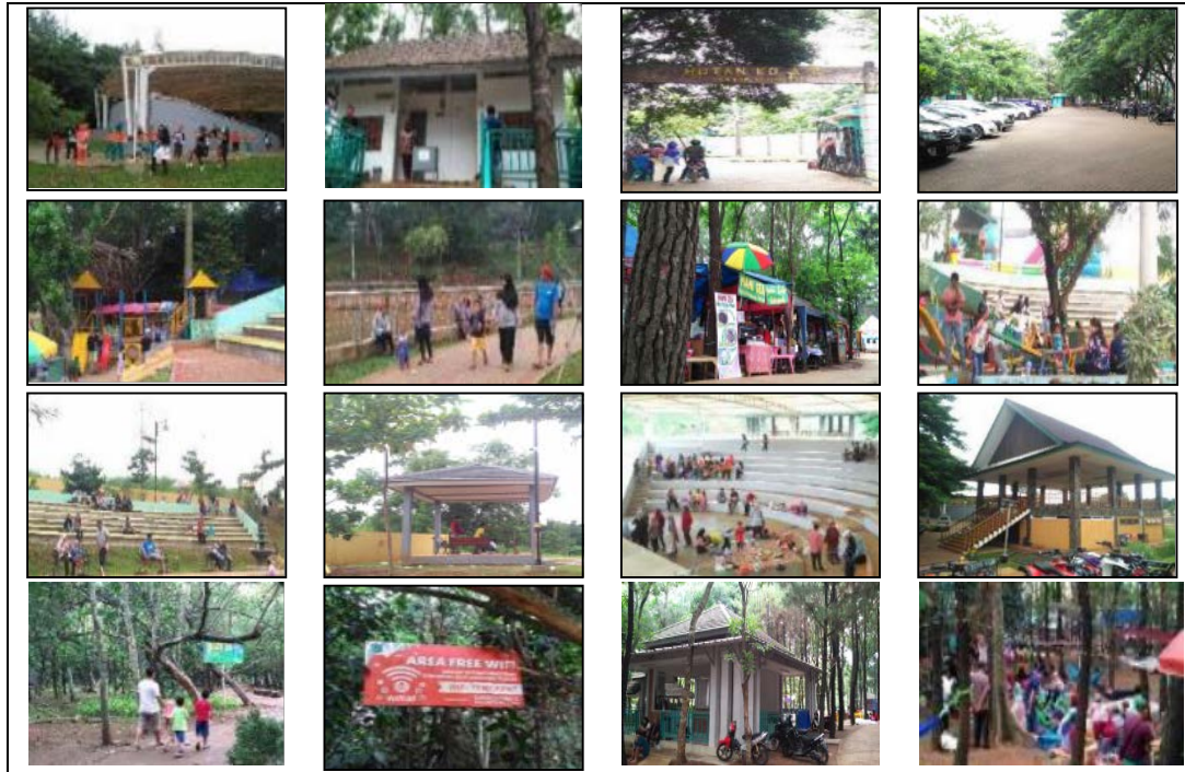
Gambar 2 Pemanfaatan Fasilitas dan Suasana Hutan Kota 2