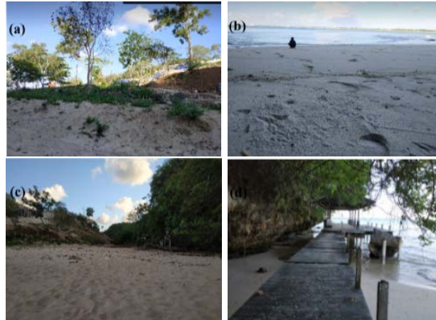
Gambar 3. Beragam Pemandangan yang Menarik di Pantai Pemuda

Secara alami, Pantai Pemuda memiliki pemandangan cukup indah ( good view ) (Gambar). Namun, keadaan tapak pada kawasan pantai yang belum tertata secara maksimal menjadikan tapak ini dari segi visual tidak memiliki kualitas yang mendukung ( bad view ). Hal ini dikarenakan kurangnya perhatian Pemerintah dan desa sekitar dalam mengelolah wisata Pantai Pemuda. Akses menuju Pantai Pemuda secara umum tertutup oleh lahan milik resor yang ada di sekitar pantai. Hal tersebut menunjukkan bahwa keberadaan pantai ini tidak cukup diketahui baik oleh masyarakat sekitar dan turis secara umum.