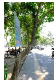
b). Percabangan Menghalangi Jalur Joging