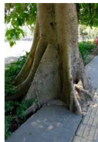
a). Kerusakan Perkerasan oleh Akar Pohon

Beberapa pohon bertajuk lebar seperti Bungur, Angsana, dan Bodhi berfungsi sebagai peneduh. Ukuran tajuk yang lebar dan jarak tanam yang rapat menyebabkan jalur jogging merupakan daerah yang selalu ternaungi sehingga berbagai kegiatan yang dilakukan di jalur jogging dapat dilakukan dengan nyaman. Dominasi Bungur pada area ini tidak hanya digunakan sebagai peneduh tetapi juga pengarah dan estetika terutama saat bunga Bungur sedang mekar. Akan tetapi, mekarnya bunga Bungur ini akan menghasilkan banyak sampah karena jumlahnya yang banyak dan berukuran kecil. Permasalahan lainnya yang timbul karena letak Bungur dan pohon lainnya berada dekat dengan jalur jogging yaitu perakaran pepohonan ini merusak perkerasan disekitarnya baik jalur jogging maupun planterbox serta percabangan pohon yang melintang di atas jalur jogging (Gambar 3) sehingga mengganggu pengguna terutama pengguna jalur khusus difabel. Penanganan yang dapat dilakukan oleh pemerintah yaitu dengan pemindahan pohon maupun penebangan. Selanjutnya hal ini harus menjadi perhatian perancang taman kota maupun pemerintah untuk dapat menyediakan fasilitas yang fungsional.