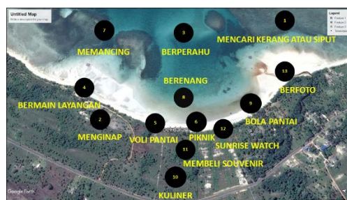
Gambar 4. Konsep Aktivitas Wisata

Kawasan wisata di Pantai Teloeok Dalam masih dibutuhkan banyak atraksi wisata untuk meningkatkan daya tarik wisatawan. Berdasarkan hasil wawancara, pilihan wisata di sekitar masih sedikit dan atraksi yang ditawarkan cenderung monoton. Pada konsep perencanaan kawasan wisata ini terdapat 13 aktivitas yang dapat dilakukan oleh wisatawan antara lain memancing, berperahu, mencari kerang, berenang, berfoto, piknik, dan bola pantai. Selanjutnya pengunjung juga dapat melakukan aktivitas voli pantai, bermain layangan, menginap, memandangi sunrise , membeli cendera mata, dan kuliner (Gambar 4). Aktivitas tersebut dapat dilakukan di dua dari tiga ekosistem yang ada pada tapak, yaitu ekosistem pantai dan padang lamun. Sensitivitas estuari sangat rentan sehingga area ekosistem sekitar sungai tidak dibuka untuk menjaga keberlanjutannya. Area terestrial di ekosistem pantai memiliki luas daratan yang cukup dan memungkinkan untuk dikembangkan. Selanjutnya, area akuatik menyimpan manfaat lebih dari sekedar kegiatan rekreasi. Alasannya adalah karena ekosistem lamun memiliki nilai penting yang menjadikan kawasan ini kaya akan keanekaragaman fauna air seperti gonggong yang merupakan satwa khas pantai ini. Terlebih pengembangan wisata berbasis ekosistem lamun masih jarang dilakukan dikembangkan di Indonesia (Kordi, 2011).