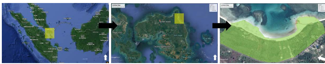
Gambar 1. Lokasi Studi Kepulauan Riau (kiri), Pulau Bintan (tengah), dan Lokasi Tapak (kanan).

KI = Kapasitas pengunjung menginap (orang)