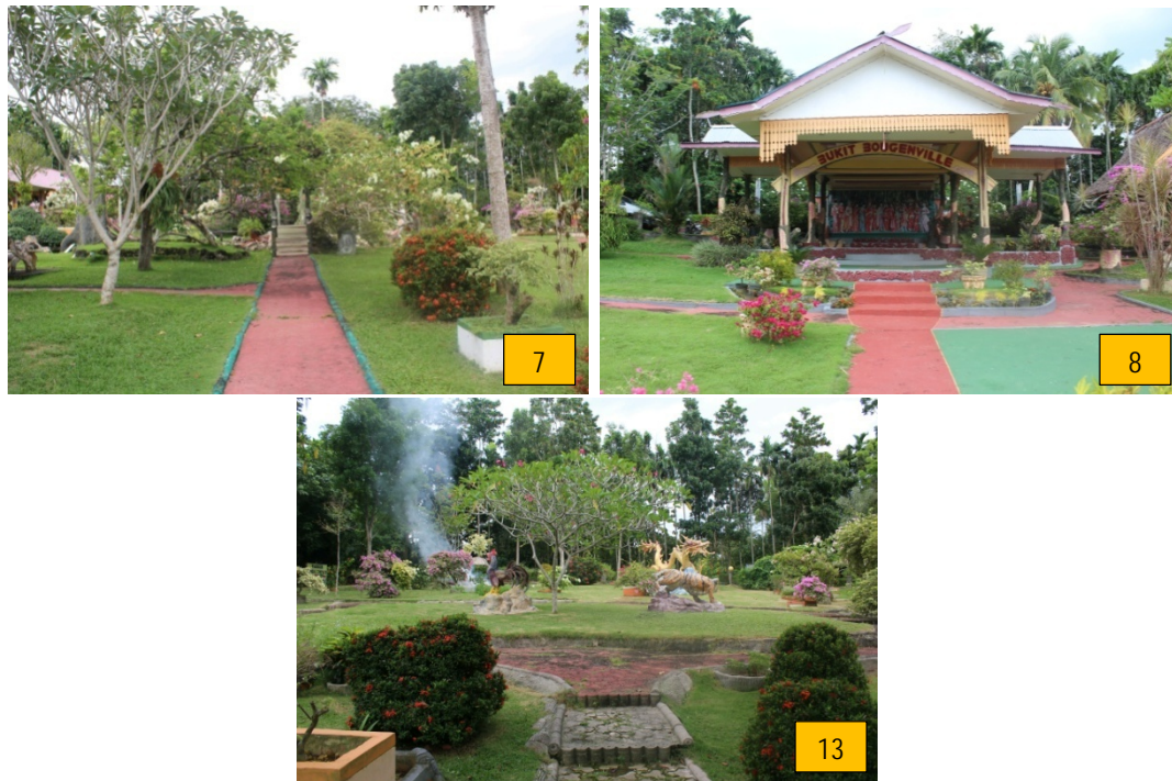
Gambar 5. Lanskap dengan Kualitas Estetika Rendah