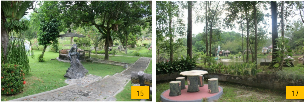
Gambar 6. Lanskap dengan Kualitas Estetika Sedang