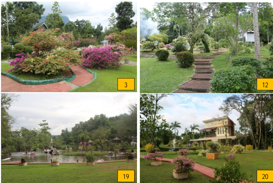
Gambar 7. Lanskap dengan Kualitas Estetika Tinggi

Lanskap dengan kualitas estetika tinggi terlihat dari proporsi vegetasi yang cukup dominan, sedikit bangunan dengan kualitas fisik yang baik dan menarik. Lanskap 3, lanskap 12, lanskap 19 dan lanskap 20 merupakan lanskap yang memiliki estetika tinggi.