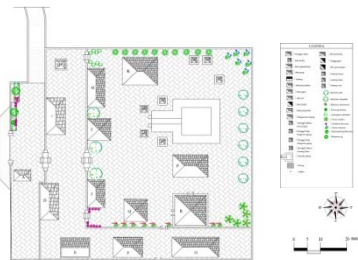
Gambar 4.. Rekomendasi Penataan Tanaman di Zona Inti

Elemen lunak meliputi 27 jenis tanaman dengan letak tanaman tidak ditata secara khusus, sehingga diberikan rekomendasi penataan tanaman di zona inti dan penyangga Pura Mengening.