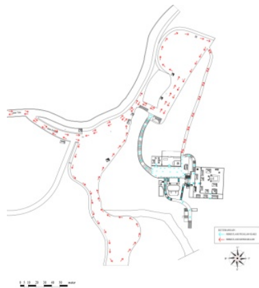
Gambar 2. Sirkulasi di Kawasan Pura Mengening Keterangan : Pengolahan data, 2016