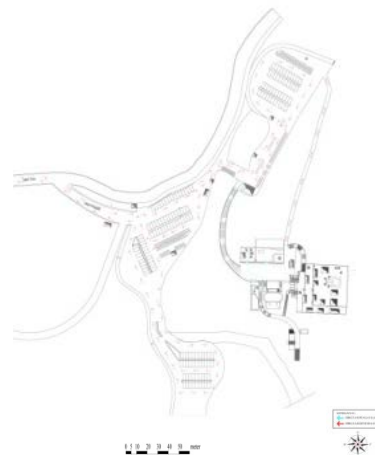
Gambar 3. Rekomendasi Sirkulasi di Kawasan Pura Mengening Keterangan : Pengolahan data, 2016