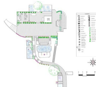
Gambar 5. Rekomendasi Penataan Tanaman di Zona Penyangga