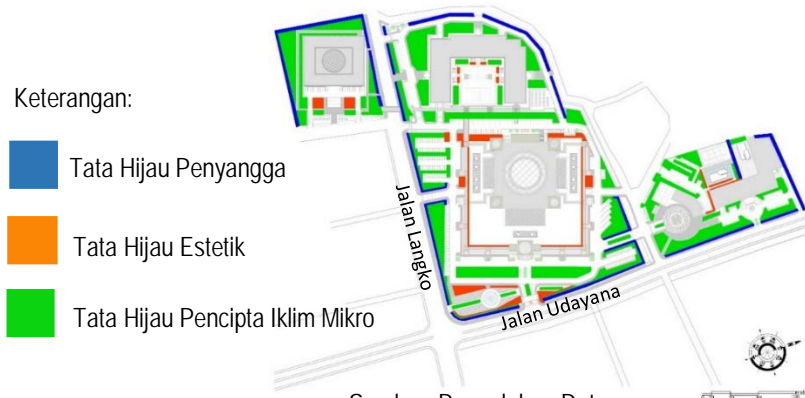
Gambar 4. Rencana Tata Hijau

Tata hijau akan sangat berperan dalam memberikan kenyamanan pada Taman Islam agar pengguna nyaman melakukan ibadah serta menyajikan keindahan taman Islam sebagai gambaran dari surga. Penggunaan vegetasi dalam tapak dapat memberikan keseimbangan alam serta menjaga kelestarian lingkungan. Pemilihan jenis vegetasi dan peletakkannya harus disesuaikan dengan tujuan perencanaan dan fungsi dari tanaman itu sendiri. Selain itu, tanaman yang dipilih juga harus memenuhi karakteristik taman Islam dimana tanaman yang digunakan tidak berpotensi membahayakan pengguna tapak. Jenis tata hijau pada tapak dikelompokkan berdasarkan fungsinya, diantaranya adalah tata hijau estetik, tata hijau penyangga, dan tata hijau pencipta iklim mikro (Gambar 4).