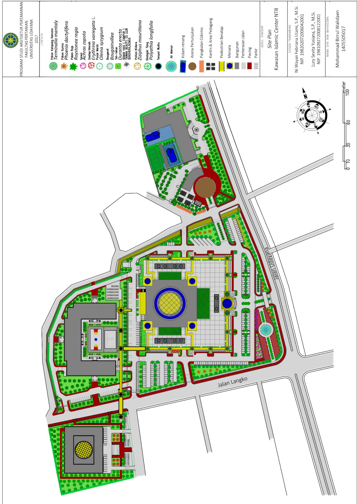
Gambar 5. Site Plan Taman Islam Islamic Center NTB