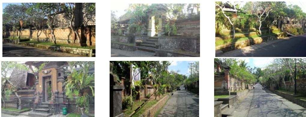
Gambar 3. Telajakan Desa Pakraman Nyuh Kuning Ubud (2014).

Tahun 1996 - 2000 telajakan mulai di kelola dan di lestarikan oleh seluruh masyarakat Desa Pakraman Nyuh Kuning, dibuktikan dengan pengesahan awig-awig tentang telajakan pada tahun 1994. Telajakan mulai di tata sedemikian rupa dan didukung dengan adanya inovasi dan variasi yang terjadi di setiap telajakan sesuai dengan selera pemiliknya. Model telajakan yang ada di Nyuh Kuning dari datar sampai berterastering sesuai keadaan tapak.