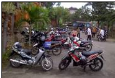
Gambar 1. Kondisi di Area Masuk GKSMIT

GKSMIT didesain oleh seorang arsitektur beragama Katolik bernama Prof. Dr. Sulistyawati, M.Sc dengan mencerminkan budaya Bali (Mugi, 2011 b). Pemilihan tanaman pada lansekap GKSMIT tanpa konsep atau pedoman tertentu dari gereja Katolik, sehingga kualitas estetika pemandangan menjadi kurang baik ( bad view ). Fasilitas yang terdapat di GKSMIT yaitu tempat parkir mobil, tempat parkir motor, gazebo dan toilet. Gambar 1-3 menunjukkan kondisi estetika pemandangan dalam lansekap GKSMIT.