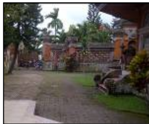
Gambar 2. Kondisi di Area Suci GKSMIT