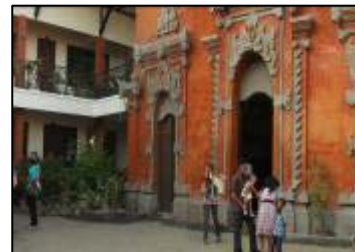
Gambar 3. Kondisi di Area Sekretariat GKSMIT