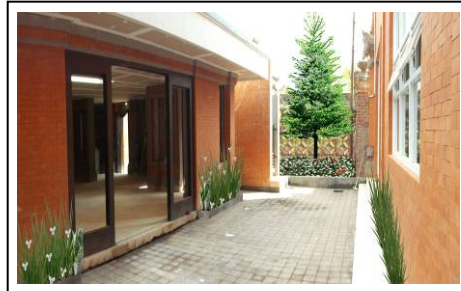
Gambar 5. Ilustrasi Rekomendasi Penataan Taman di Area Bangunan Utama GKSMIT

disampaikan adalah rasa terisolasi namun tidak terpenjara. Warna kuning pada bunga Iris Liar kuning memberi kesan mulia serta untuk memecah monoton warna hijau tanaman. Gambar 5 menunjukkan ilustrasi rekomendasi penataan taman di area bangunan GKSMIT.