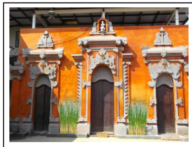
Gambar 6. Ilustrasi Rekomendasi Taman di Aula GKSMIT

Aula gereja merupakan bangunan tertutup, sehingga kesan yang ingin disampaikan ditampilkan pada pintu masuk dan pintu keluar aula. Tipa ( Thypha angustifolia ) dimanfaatkan sebagai dekorasi untuk memperhalus perkerasan dari dinding bangunan. Fungsi lainnya untuk mengurangi silau dari paparan sinar matahari yang mengenai dinding luar bangunan (Booth, 1979). Tipa melambangkan semangat umat Katolik yang taat pada Yesus (Gray, 2013). Ilustrasi rekomendasi taman ditampilkan pada Gambar 6.