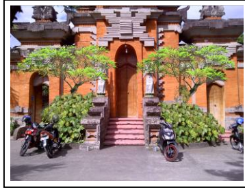
Gambar 7. Ilustrasi Rekomendasi Taman di Area Masuk GKSMIT

Sepanjang pintu masuk menuju bangunan utama GKSMIT terdapat dinding pagar. Area tersebut ditanam tanaman untuk memberi rasa nyaman bagi pengguna dengan komposisi Palem Putri, Begonia ( Begonia semperflorens ) dan Kembang Kertas ( Zinnia elegans ). Tujuannya untuk memperhalus perkerasan dari dinding pagar, sesuai dengan fungsi visual keindahan dari tanaman (Handayani, 2008).