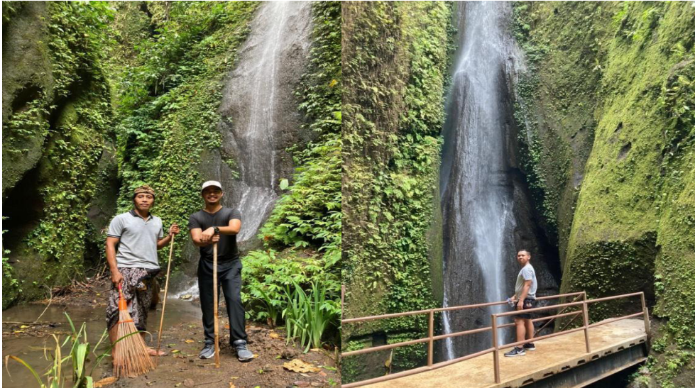
Foto 1. Penulis bersama Ketua Pokdarwis di Air terjun Aan Secret Waterfall

Terlepas dari cerita lika-liku penemuan Aan Secret Waterfall, berlangsung pula kegiatan ibu-ibu PKK Desa Aan dalam membentuk kelompok binaan yang dinamai “Kelompok Sari Amerta” dan beranggotakan 20 orang. Kelompok ini dibina oleh organisasi pengabdian masyarakat dari pemerintahan dan akademisi yang didanai oleh Kementerian Riset dan Teknologi (Kemenristekdikti). Binaan ini bertujuan untuk memberikan peluang ekonomi dan menambah penghasilan bagi masyarakat lokal. Kegiatan binaan dan pendampingan yang dilakukan di desa ini meliputi pelatihan membuat VCO ( virgin coconut oil ) dan sabun herbal yang menggunakan propolis sebagai bahan dasar. Dikarenakan kesulitan mendapatkan propolis, kelompok Sari Amerta mencoba melakukan pembudidayaan lebah keke ( trigona ) untuk menghasilkan propolis.