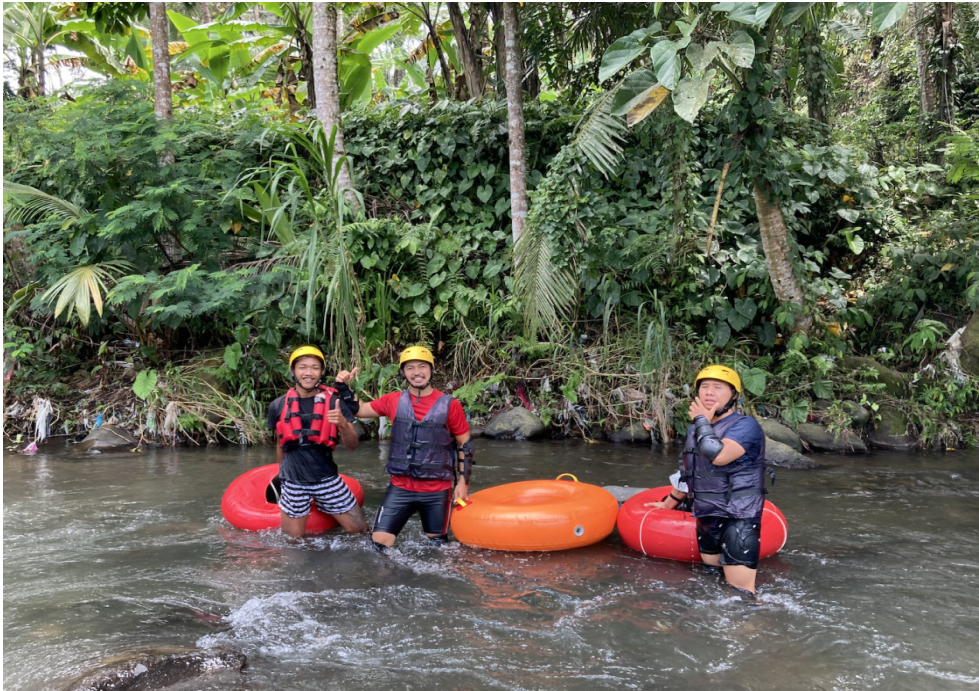
Foto 3. Atraksi river tubing di Petapan Park Desa Wisata Aan

kegiatan pariwisata. Terdapat beberapa potensi yang dimiliki desa wisata Aan dan dikategorikan menjadi tiga kategori diantaranya: (1) Wisata alam yang terdiri dari pemandangan alam atau lanskap subak dengan hamparan sawah yang indah, air terjun Aan Secret Waterfall, Air Terjun Petapan, Air Terjun Celek-celek, keragaman flora dan fauna, perkebunan durian, manggis, dan lain-lain, serta perbukitan ( sunrise point ), sungai, dan aliran irigasi subak. (2) Wisata seni dan budaya, terdiri dari ritual kegiatan upacara adat istiadat, kegiatan gotong-royong warga setempat, pementasan tarian tradisional (Barong Nong Nong Kling), ritual pelukatan , museum lukis, dan patung Sukanta Wahyu. (3) Wisata buatan, terdiri dari kegiatan trekking , outdoor , outbond , river tubing (Foto 3), fasilitas taman rekreasi anak, camping ground , wisata bersepeda, edu-wisata (budidaya madu kele, industri sabun herbal, dan industri virgin coconut oil ), ayunan ( swing ), dan belajar memasak jajanan tradisional.