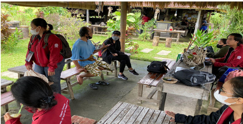
Foto 5. Ketua Pokdarwis menerima kunjungan mahasiswa