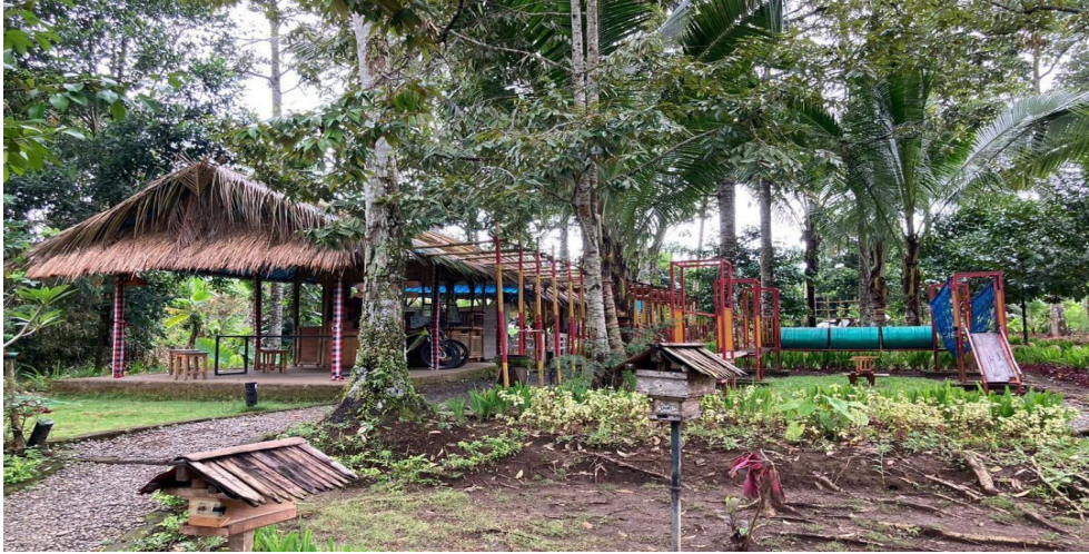
Foto 4. Fasilitas arena bermain di Petapan Park, Desa Wisata Aan