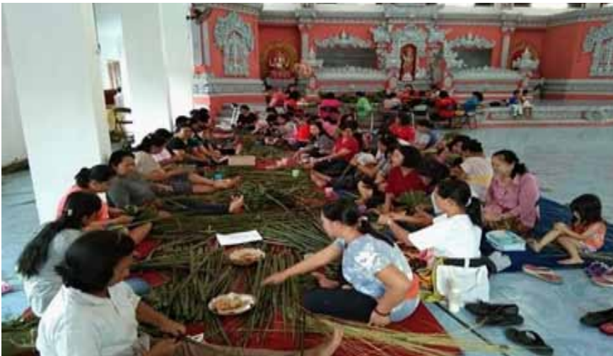
Foto 3. Eksistensi ngayah umat Hindu pada saat piodalan.

Konsep ngayah dalam kehidupan masyarakat Bali di Kelurahan Tangkiling tidak hanya tercermin dalam kehidupan sehari-hari dalam berinteraksi dengan masyarakat atau tetangga yang berbeda suku dan agama. Konsep ngayah ini juga masih sangat kental terlihat dalam kehidupan keberagaman salah satunya pada saat piodalan di Pura. Penganut agama Hindu di Kelurahan Tangkiling tidak hanya orang Bali tetapi juga berasal dari Suku Jawa dan Dayak. Namun, dalam berinteraksi khususnya pada saat piodalan mereka semua berbaur menjadi satu bergotong royong dalam menyiapkan segala sesuatunya. Sebagaimana tampak dalam Foto 3.