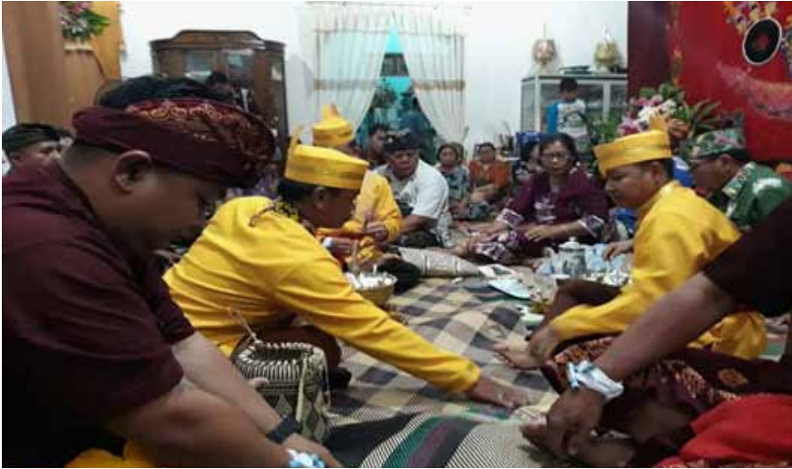
Foto 1. Keterlibatan masyarakat Bali pada ritual perkawinan adat Dayak

Foto 1 menunjukkan transmigran asal Bali di Kelurahan Tangkiling menghadiri acara ritual perkawinan suku Dayak yang merefleksikan spirit toleransi yang bersifat dinamis dalam artian toleransi yang terbentuk dibarengi dengan wujudnya dalam bentuk perilaku yang ditunjukkan dengan jalinan silaturahmi lintas suku dan agama. Hal ini senada dengan pendapat yang disampaikan oleh Ali bahwa sikap toleransi di tengah-tengah masyarakat secara umum terbagi menjadi dua, yaitu toleransi yang bersifat statis dan toleransi yang bersifat dinamis. Toleransi statis adalah toleransi hanya dalam bentuk teori tanpa adanya kerjasama yang dilakukan oleh warga masyarakat yang berbeda adat budaya, dan agama. Sedangkan toleransi dinamis adalah toleransi yang bersifat aktif yang melahirkan kerja sama antara warga masyarakat guna mencapai tujuan bersama (Ali, 1989:16; Rahmawati, 2018 )