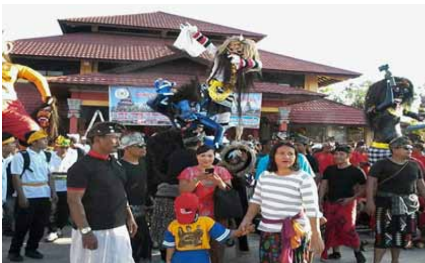
Foto 4. Masyarakat Bali di Kota Palangka Raya dalam pawai ogoh-ogoh menyongsong hari suci Nyepi

Ogoh-ogoh sebagai simbol buta kala di Bali yang diarak pada saat perayaan tawur kesanga sehari sebelum hari raya Nyepi sampai saat ini masih eksis dipraktikkan oleh generasi muda Hindu yang berada di Kelurahan Tangkiling, Mereka membuat ogoh-ogoh dengan dana swadaya masyarakat dengan mengambil tema sesuai dengan arahan PHDI Provinsi Kalimantan Tengah. Sebagaimana Foto 4.