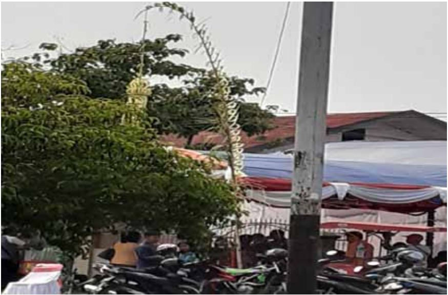
Foto 5. Penjor sebagai simbol adanya ritual perkawinan

Penjor sebagai adat budaya masyarakat Bali yang bernafaskan Hindu sampai saat ini masih tetap eksis pemakaiannya di Kelurahan Tangkiling. Penjor selain digunakan pada saat hari raya galungan dan kuningan juga digunakan pada saat piodalan di pura. Namun, penggunaan penjor sebagai adat budaya masyarakat Bali di Kelurahan Tangkiling menunjukkan adanya proses akomodasi, di mana penjor tidak hanya digunakan masyarakat Bali tetapi juga diadopsi oleh masyarakat non-Bali, utamanya adalah penjor yang dianggap profan. Penjor ini biasa dijadikan hiasan pada saat ada ritual perkawinan, sebagaimana Foto 5.