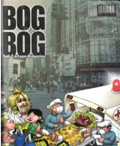
Tema Rumah Sakit

Berikut adalah beberapa sampul dalam majalah Bog-Bog sesuai tema yang diangkat sebagai cover story . Tema yang diangkat selalu disesuaikan dengan isu aktual atau aktualisasi isu-isu yang terlupakan, seperti kepadatan lalu-lintas, pariwisata, dan lingkungan.