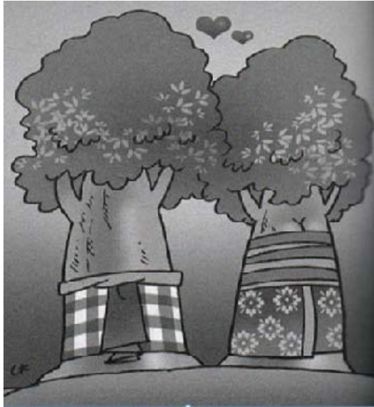
Gambar 6 Personifikasi Pohon KepahKepuh

upacara, bahkan masyarakat tidak menggunakan sebagai kayu bakar (Wawancara Ida Bagus Sudiksa, 16 Desember 2016).