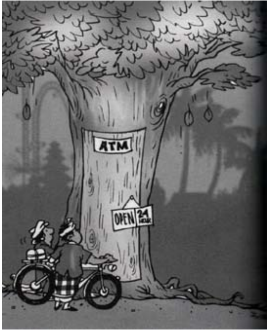
Gambar 3 Parodi Pohon Besar sebagai Tempat Penarikan Uang (ATM)

Gambar ini terdiri dari satu frame dengan ilustrasi pohon yang bertuliskan ATM dan open 24 hour dengan gaya tulisan screef , dilengkapi orang berkarakter Bali, warna hitam putih ( blur ). Dalam catatan redaksional Bog-Bog edisi Nomor 10 Volume 10 Tahun 2012 penghargaan terhadap pohon dituliskan sebagai berikut: