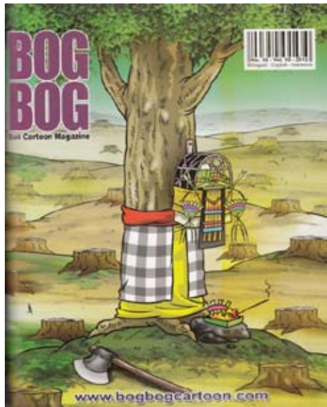
Gambar 4 Sakralisasi Pohon

Strategi pembangunan yang berorientasi ekologis idealisnya berkembang dari pengetahuan lokal. Kearifan ekologi tumbuh dan hidup dalam kondisi sosial budaya dan bio-geofisik tertentu (Resosudarmo dan Colfer, 2003: xxi). Di dalamnya terdapat praktik pengelolaan hutan yang adaptif yang berkembang dan berevolusi dengan dinamika lingkungan hidup. Gambar 4 menunjukkan sebuah gagasan tentang pencegahan pengawahatanan yang berorientasi kearifan lokal ( local genius ). Umumnya pohon-pohon tumbuh besar di Bali karena dikeramatkan.