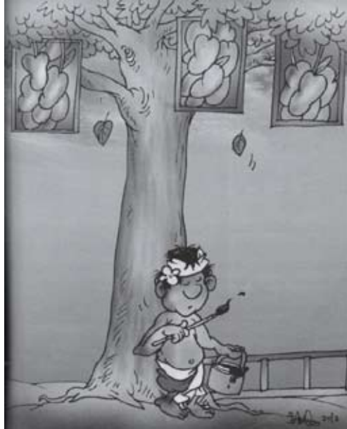
Gambar 1 Fungsi Estetika dan Rekreasi pada Pohon

Pada gambar 1 dilukiskan seorang seniman dengan gaya visual kartun melukis buah-buahan di ranting-ranting pohon mirip buah mangga. Gambar buah-buahan yang dilukis terlihat sangat mirip dan terkesan menyatu dengan pohon. Dilihat dari setting gambar ini berbentuk frame dengan komposisi objek statis. Warna sangat sederhana abu-abu dengan nada ringan ( blur ). Karakter gaya Bali menjadi ciri khas gaya kartun majalah bog-bog . Menurut Covarrubias (dalam Vickers, 2012) seniman Bali merupakan peniru yang baik. Kemampuan menggambar alam dengan kemiripan yang cukup baik diperoleh karena penghayatan kepada alam. Bagi seniman kiasan tentang alam dalam berbagai ekspresi seni menurut Covarrubias merupakan sebuah persembahan kepada sang pencipta.