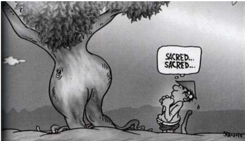
Gambar 5 Pohon Keramat

hidup, para leluhur mengerti menjaga kelestarian hutan demi kelangsungan kehidupan masyarakat. Kelestarian sumber daya hutan tercermin dari keberlanjutan fungsi ekologi dan manfaat sosiokulturalnya (Santoso, dalam Utari, 2012: xxi). Pada Gambar 5 terlihat seorang petani yang sedang memandang sebuah pohon dengan rasa takut. Dalam balon kata tertulis sacred (keramat). Gambar 5 mewakili pandangan orang Bali terhadap pohon-pohon besar. Sebagian masyarakat menganggap adanya makhluk-makhluk sakral yang mendiami pohon-pohon besar. Rasa takut mendorong masyarakat bersikap hormat dan tidak mengusik atau merusak pohon.