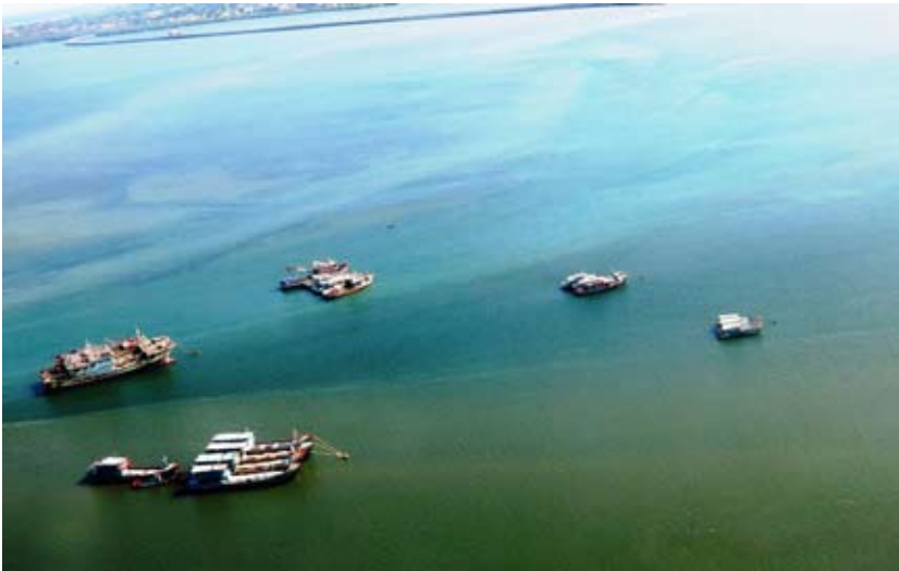
Foto 2. Beberapa kapal menjangkar di aeral Teluk Benoa, di kejauhan tampak jalan toll Bali Mandara

Di samping itu, terdapat juga benda-benda yang dianggap suci atau pusaka yang dihormati oleh warga masyarakat atau kelompok kekerabatan lainnya. Benda-benda tersebut, seperti panji-panji, kitab suci Alquran di samping senjata-senjata seperti tersebut di atas.