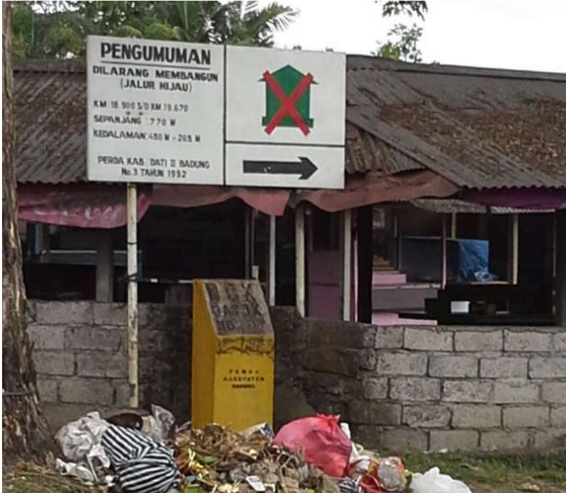
Foto 1. Pelanggaran bangunan di kawasan lahan sawah atau jalur hijau

bahwa tidak efektifnya pengendalian alih fungsi lahan sawah disebabkan oleh: (1) kurang kuat dan padunya koordinasi antar-lembaga terkait, (2) lemahnya sistem administrasi tanah, (3) pelaksanaan di lapangan yang kurang konsisten dan serius, (4) peraturan yang ada bersifat paradoksal dan dualistik, (5) belum dilibatkannya petani pemilik lahan dan kelembagaan lokal secara aktif. Di lihat dari sisi perkembangan eksternal, kurang efektifnya pengendalian alih fungsi lahan sawah di daerah penelitian dipicu oleh perkembangan sektor pariwisata yang jauh lebih pesat dibandingkan dengan kecepatan Pemerintah Daerah dalam mengantisipasi fenomena tersebut.