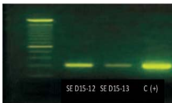
Gambar 2 Hasil Uji PCR Identifikasi Salmonella enteritidis Kode SE DI15-12 dan SE DI15-13 menunjukkan panjang pita amplikon yang sama dengan dengan kontrol positif (C +) S. enteritidis ATCC 13076 (target pita amplikon 304 bp)

Keterangan: Isolat E. coli kode I5B, I2C, I9C, I4E, II3B, DI15, dan DII10 positif memiliki gen mcr-1 dengan adanya pita amplikon 309 bp. Isolat E. coli kode I18D, II9B, dan DIII18 tidak memiliki gen mcr-1 karena tidak menunjukkan pita amplikon target di 309 bp (Liu et al. , 2015; Cavaco et al. , 2016)