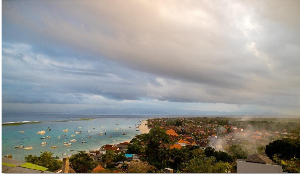
Foto 1. Desa Jungutbatu, Nusa Lembongan