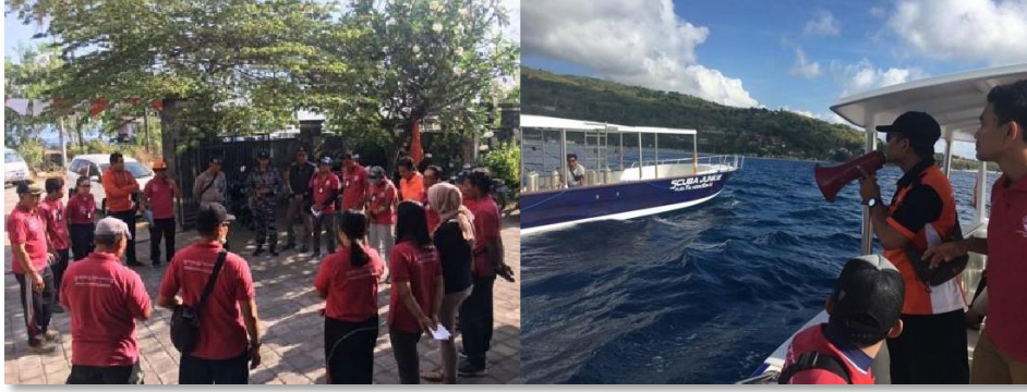
Foto 4. Kegiatan Pengawasan UPT KKP Nusa Penida