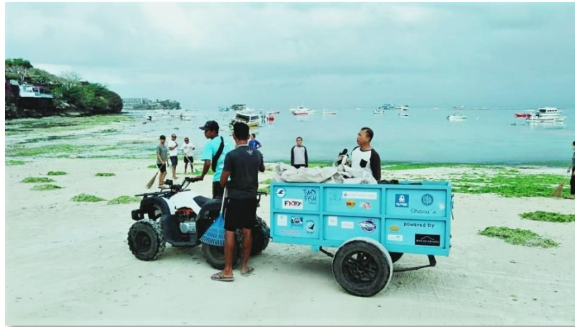
Gambar 3. Kegiatan Bersih – Bersih Pantai Desa Jungutbatu (Primanda, 2019)

Namun seiring dengan bertumbuhnya aktivitas pariwisata, disertai dengan semakin bertambahnya tenaga kerja serta wisatawan yang datang, maka usaha – usaha tersebut harus dapat dilakukan dengan berkelanjutan dan konsisten. Hal ini sering kali terkendala dari sisi pendanaan untuk menerapkannya, maka dari itu selain pemanfaatan pembiayaan dari pengenaan biaya masuk kawasan, koordinasi yang baik antara pihak – pihak yang mengelola dan memanfaatkan kawasan bahari Desa Jungutbatu merupakan salah satu hal yang dapat dilakukan untuk menanggulangi permasalahan pendanaan yang dialami.