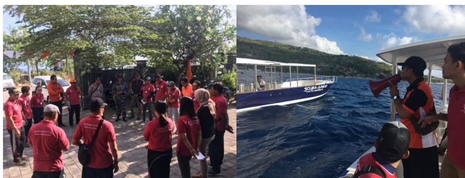
Gambar 4. Kegiatan Pengawasan UPT KKP Nusa Penida (UPT KKP Nusa Penida, 2019)

Meskipun pengawasan yang dilakukan pada kawasan bahari Desa Jungutbatu belum dapat dilakukan secara optimal akibat permasalahan biaya operasional, namun pelibatan masyarakat dalam proses perencanaan, pengelolaan dan pemanfaatan dari kawasan bahari Desa Jungutbatu, membangun kesadaran masyarakat untuk turut serta berpartisipasi dalam pengawasan. Mengingat semakin meningkatnya jumlah kunjungan wisatawan yang melakukan aktivitas wisata di kawasan bahari Desa Jungutbatu, kemungkinan untuk terjadinya pelanggaran baik yang disengaja ataupun tidak disengaja juga akan meningkat. Untuk itu, agar dapat lebih memaksimalkan pengawasan yang dilakukan di kawasan bahari Desa Jungutbatu, maka perlu dilakukan pengalokasian pendanaan yang diterima dari biaya masuk kawasan serta pembentukan Kelompok Pengawas Masyarakat yang dapat melakukan kegiatan pengawasan sehari – hari di lapangan, dibandingkan hanya melakukan pengawasan sekali dalam satu bulan seperti yang dilakukan saat ini.