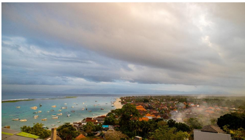
Gambar 1. Desa Jungutbatu, Nusa Lembongan (Primanda, 2019)

Long V. dan Wall G. (1996) menyebutkan pariwisata di Kawasan Nusa Penida dimulai sekitar tahun 1970 dengan dimulainya kedatangan wisatawan – wisatawan ke desa Jungutbatu di Nusa Lembongan untuk berkemah ataupun tinggal di rumah – rumah penduduk lokal. Menggunakan kapal – kapal charter wisatawan mulai datang lebih banyak pada tahun 1980 yang diikuti dengan berkembangnya guest house dan bungalow serta jenis – jenis olahraga air seperti surfing dan berbagai perubahan cara berpakaian yang dibawa wisatawan. Pantai – pantai di Desa Jungutbatu pada saat itu lebih diutamakan digunakan untuk kegiatan pertanian rumput laut, seperti menjemur hasil panen maupun tempat menyimpan alat – alat yang digunakan untuk pertanian seperti perahu kecil, tali – tali pengikat ataupun jaring, dan tidak disiapkan atau disajikan untuk kegiatan pariwisata. Namun karena harga yang terus menerus menurun dan ketidakstabilan dari pertanian rumput laut, masyarakat mulai mencari sumber pendapatan alternatif melalui pariwisata. Hingga pada akhirnya saat ini pariwisata menjadi sumber matapencaharian utama masyarakat Desa Jungutbatu.