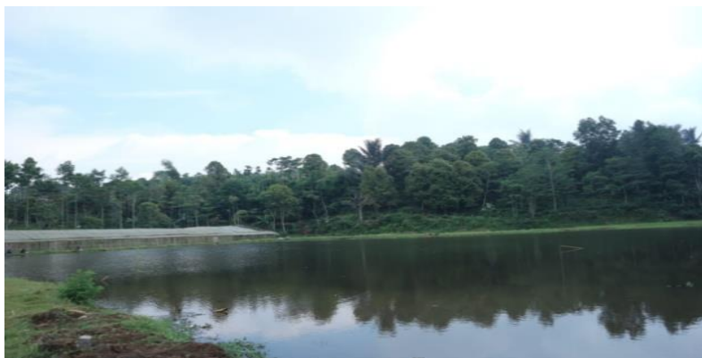
Gambar 2. Situ Lembang Dano Desa Cipada

Situ Lembang Dano adalah sebuah danau alam yang terletak di Desa Cipada, Kecamatan Cikalong Wetan, Kabupaten Bandung Barat (KBB). Danau alam ini belum dikelola secara profesional oleh pemerintah KBB dan kini kondisinya sangat memprihatinkan karena sudah terjadi pedangkalan. Jika tidak diperhatikan oleh pemerintah, bukan mustahil suatu saat danau yang berada di kaki Gunung Burangrang ini akan hilang. Selain itu situ lembang dano kurang mendapatkan perhatian masyarakat sehingga wilayah situ tersebut semakin berkurang karena tidak di kelola dengan baik. Sehingga perlu keterlibatan pemerintah juga masyarakat untuk mengembangkan situ lembang dano menjadi tempat wisata yang menarik wisatawan untuk datang sehingga dapat meningkatkan penghasilan desa Cipada.