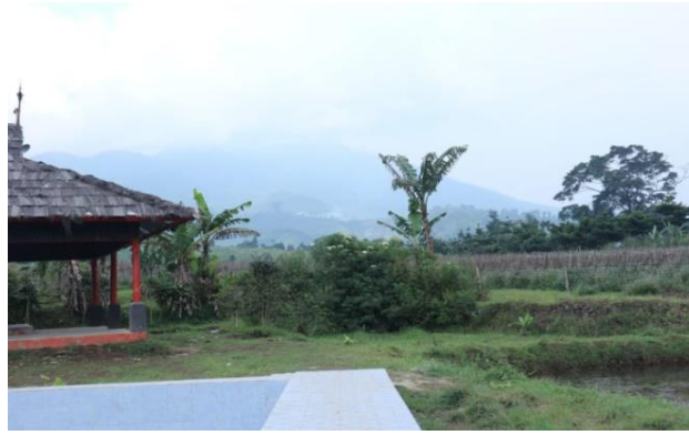
Gambar. 3 Daerah Perkebunan Lingkungan Situ Lembang Dano